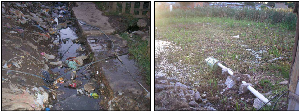
Fotos 3 y 4: Conexiones a la red de agua potable y descarga cloacal directa a la laguna

El área pertenece a la cuenca del arroyo Santo Domingo (Área=210 km 2 ), dentro de la región hidrogeológica Noreste de la provincia de Buenos Aires (González, 2005). El clima es de tipo templado – húmedo (Auge, 2004), con temperatura media anual del orden de los 17 °C (1901/1990).