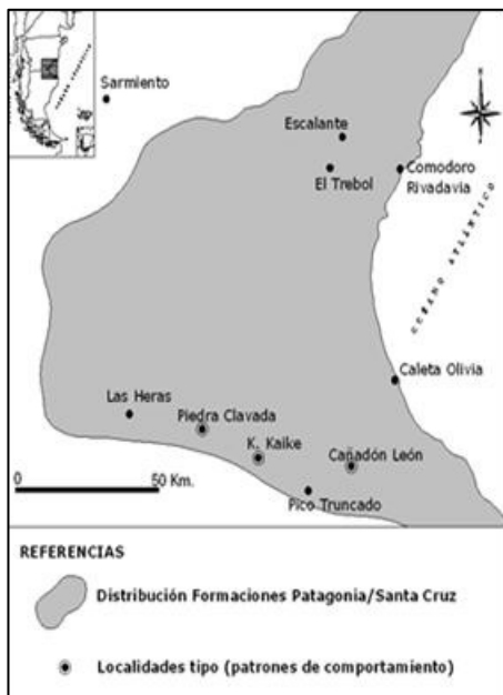
Figura 1. Ubicación de la zona (modificado de Paredes, 2002).

Comienza fundamentalmente en el sector oriental de la cuenca del Golfo San Jorge (Figura 1) y a propósito de la legislación aludida, a manifestarse la diferencia de criterios respecto a los conceptos de Formación Patagonia y acuífero "Patagoniano" que motiva esta contribución.