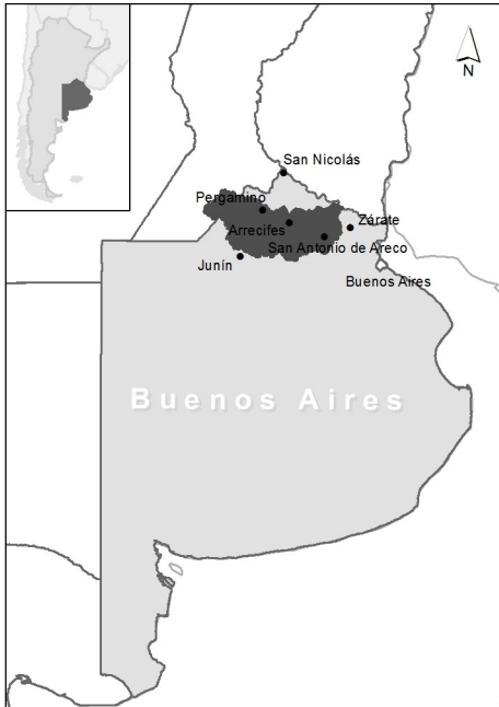
Figura 1. Localización del área de estudio

La población supera los 500.000 habitantes y la actividad socioeconómica fundamental es agrícola-ganadera, seguida de una creciente industrial, radicada a la vera del río Paraná.