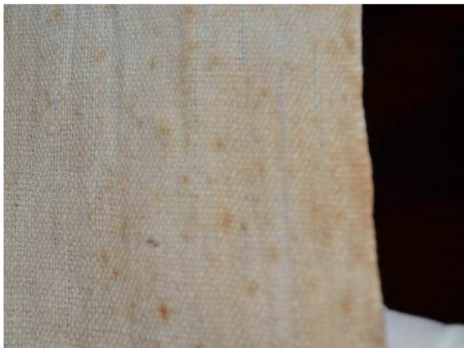
Imagen 3 - Vista general de la pieza n° 60177 en la que se observan manchas color café producto de la actividad metabólica de microorganismos.

El estudio de microscopía óptica realizado sobre algunos ejemplares del conjunto depositado en el Museo permitió relevar en detalle la organización del textil. Sobre ella se observó la presencia de estructuras biológicas oscuras alojadas en el interior de las fibras a consecuencia del desarrollo de hongos de la familia Dematiaceae.