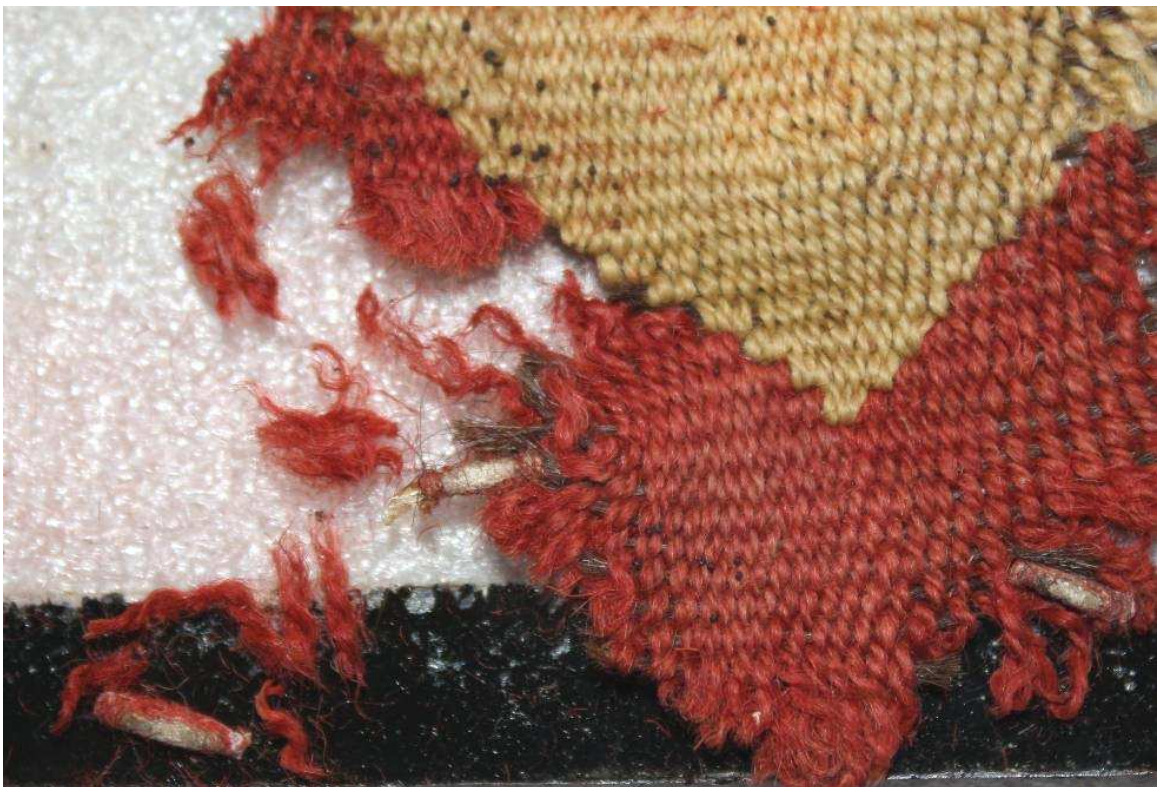
Imágenes 1 y 2 - Vista general de la pieza n° 60001 (arriba) y detalle en el que se observa evidencia de la acción de lepidópteros que dañaron la tela (abajo).