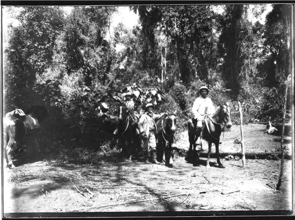
Expedición de Carlos Spegazzini a San Pedro, Misiones, Argentina