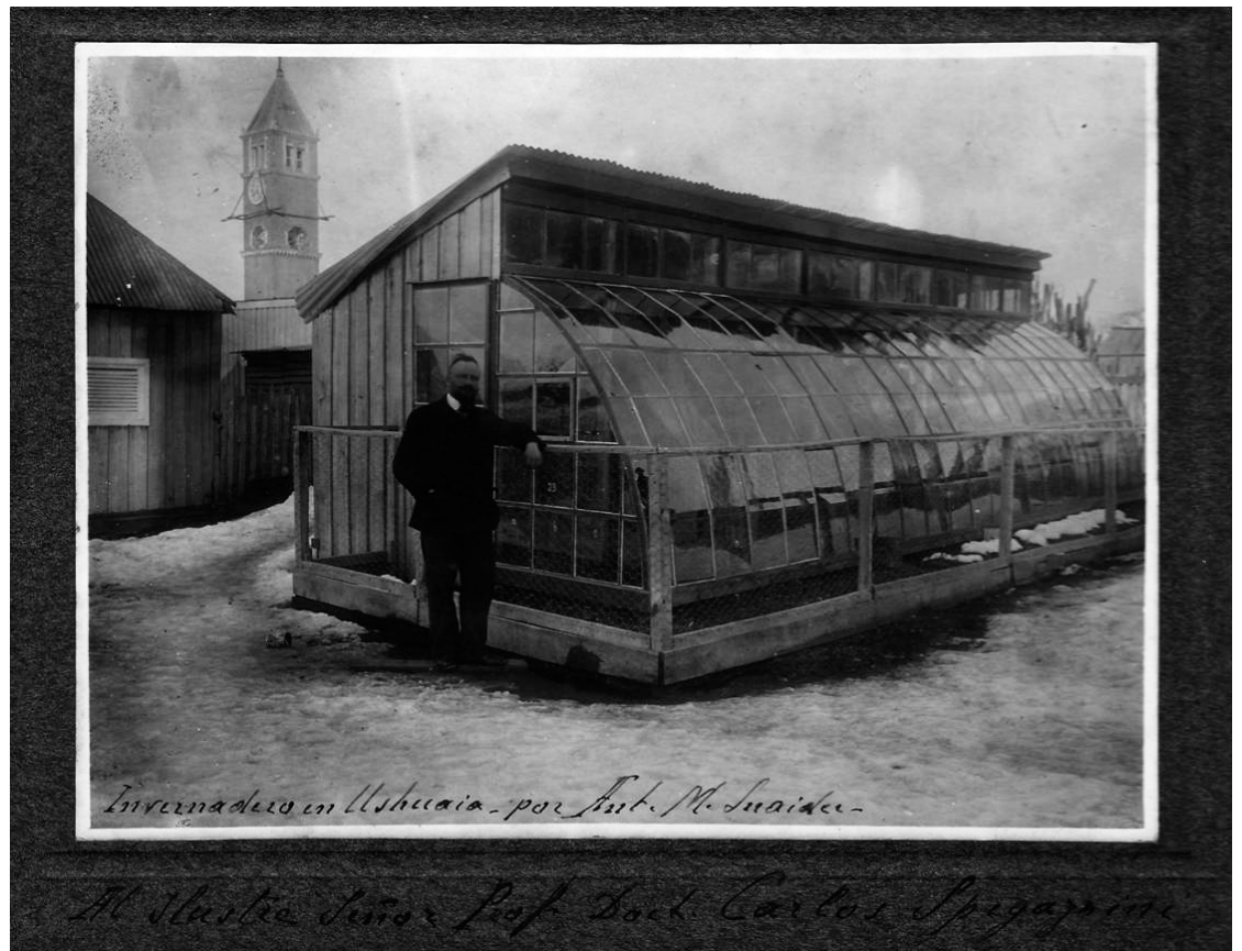
Spegazzini en un vivero en Ushuaia