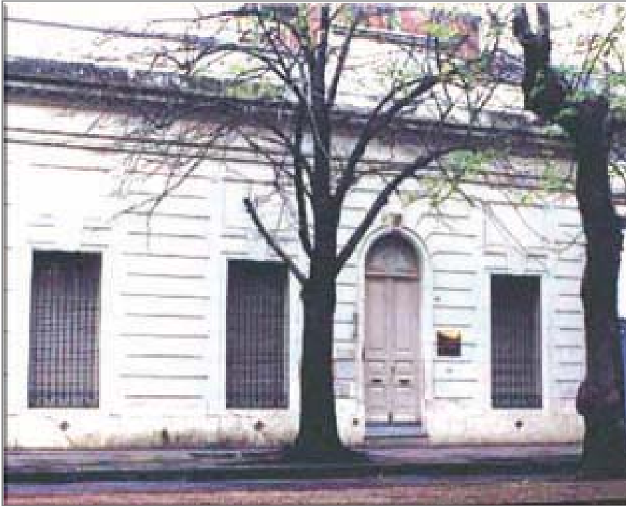
Casa de Carlos Spegazzini en La Plata donde funciona el Instituto de Botánica

Ilustración tomada de www.mushroomthejournal.com