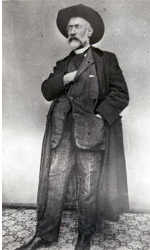
Carlos Luis Spegazzini, 1879, tomada de www.biol.unlp.edu.ar 20/04/1858, Bairo, Italia – 01/07/1926, La Plata, Argentina