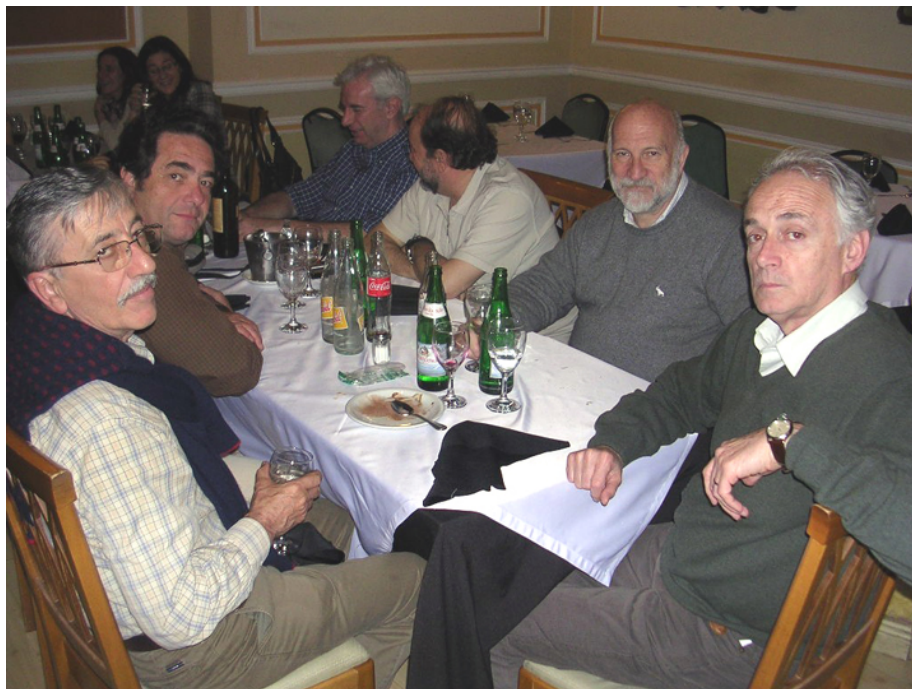
Taller Regional sobre Humedales de la Cuenca del Plata, Secretaría de Ambiente y Desarrollo Sustentable, Secretaría de Medio Ambiente, Ministerio de Aguas, Servicios Públicos y Medio Ambiente de la Provincia de Santa Fe, Santa Fe, agosto de 2008