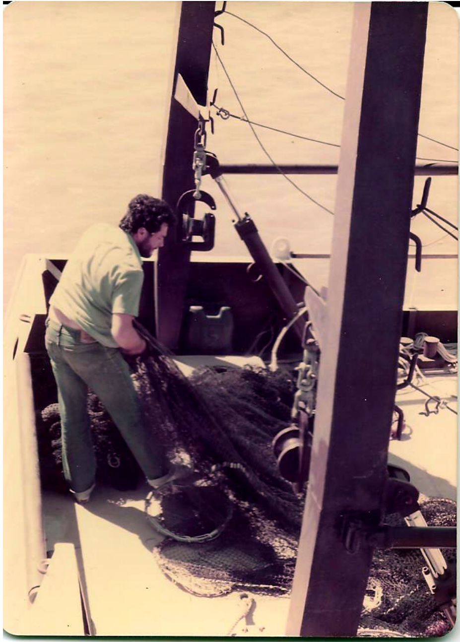
Acomodando la red en la popa del Keratella, década de los 80