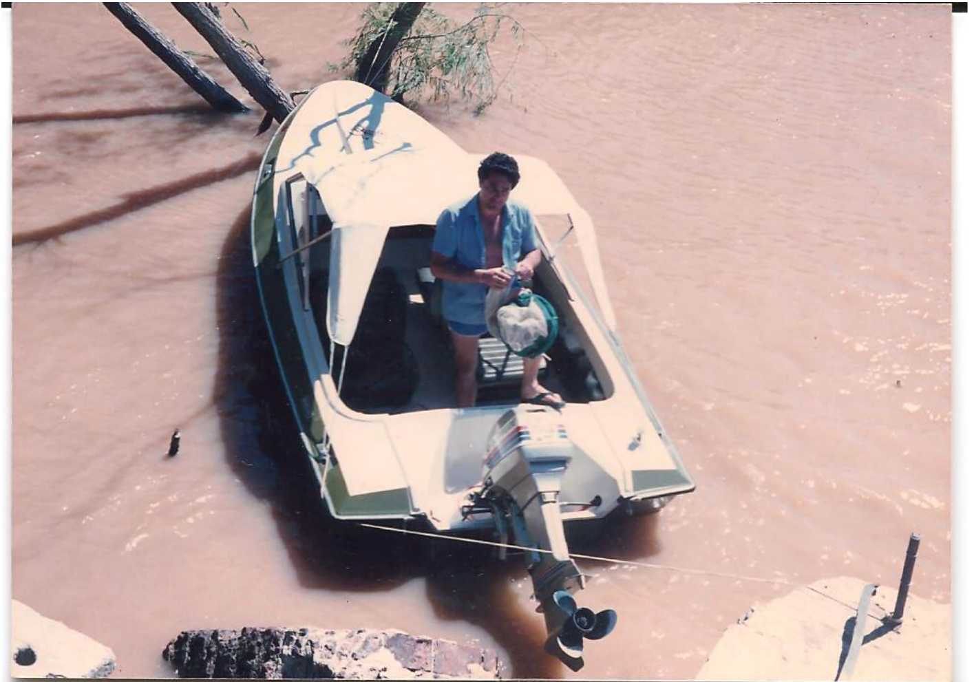
Muestreo de larvas en el Paraná medio, década de los 80