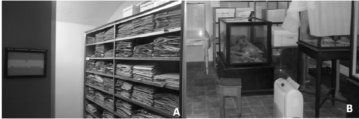
Figura 1: A: Depósito de las Colecciones Botánicas, Herbario del Museo de Ciencias Naturales de La Plata; B: Depósito de restos momificados (subsuelo Museo de Ciencias Naturales).