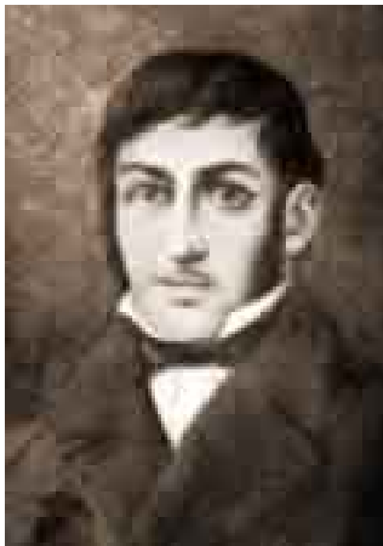
JUAN CRISÓSTOMO LAFINUR 1797-1824