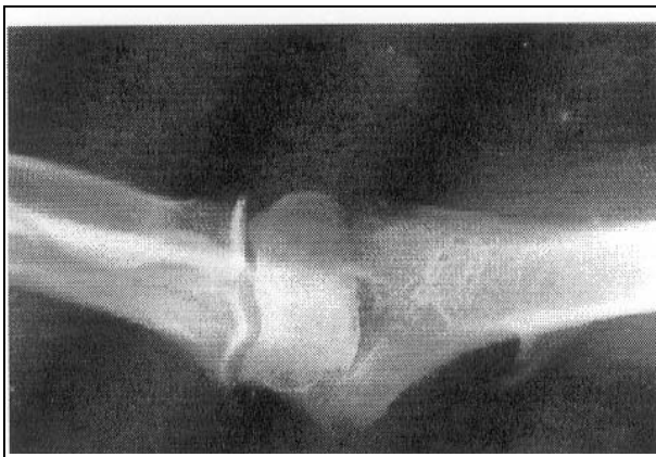
تصویر شماره ۱- رادیوگرافی خار سوپراکوندیلار

در رابطه با علائم نینز در بررسی Visual Analogue Scale درد بیمار کاهش یافته بود.