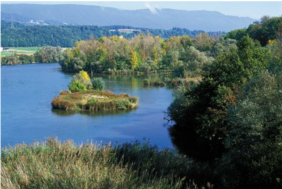
Abb. 6: Die Alte Aare bei Safnern

So tauchen die Reisenden auf dem Kulturweg Aare immer tiefer in Geschichten ein, die das Verhältnis Fluss-Mensch in den vergangenen Jahrhunderten geprägt haben und lässt sie interagieren mit seiner Wahrnehmung der Gegenwart: War das 18. und 19. Jahrhundert die Epoche der Gewässerkorrekturen und Kanalisierungen, so stand das 20. Jahrhundert im Zeichen der Staumauern und der Elektrizitätsgewinnung. Und was wird das Verhältnisses Fluss-Mensch im 21. Jahrhundert am nachhaltigsten prägen? Werden es epochale Hochwasser sein? Vielleicht wird die nächste Zeit auch von Renaturierungen und der Rückkehr des Lachses geprägt sein, der über Dutzende von Fischtreppe den Weg zurück in unsere Gewässer findet.