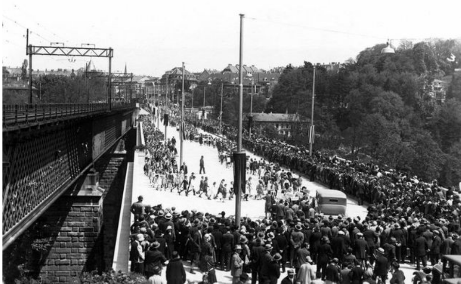
Abb. 3: Einweihung Lorrainebrücke

staltung auf Wunsch seiner Auftraggeber an diejenige der Nydeggbrücke anlehnen. Anders als bei der Nydeggbrücke rund neunzig Jahre zuvor wurden diesmal aber keine Granitblöcke von der Grimsel die Aare heruntergeschifft, sondern die verwendeten Beton-Quader wurden auf der Schützenmatte vor Ort gegossen. Innovativ ist die Brücke insofern, als erstmals in der Schweiz die Vibratortechnik zur Komprimierung des Betons angewendet wurde (Furrer et al. 1984:39; IVS 1997:73).