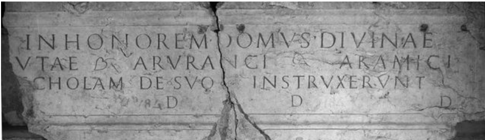
Abb. 5: Römische Inschrift in Aventicum