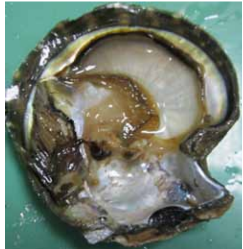
चित्र 1- मैन्टिल ऊतक a. हरी कौडी, पेर्ना विरिडिस और काली अधरवाली मोती सीप पिंक्टाडा मारगारिटिफेरा