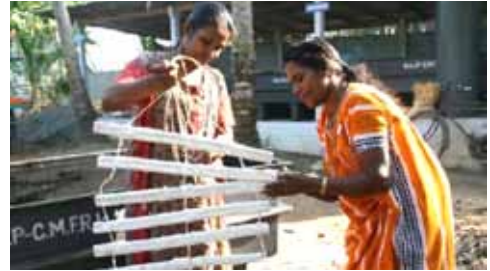
संतति संग्रह यूनिट