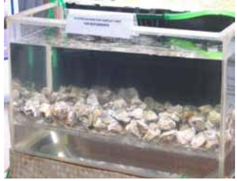
शुद्धीकरण प्रदर्शन एकक