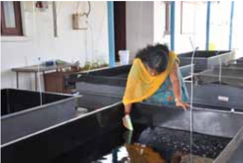
शक्ति के लिए डिम्बक पालन की सुविधा