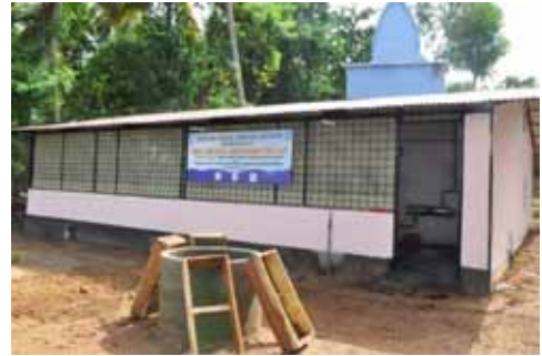
QSSS द्वारा स्थापित कवच मछलियों की मूल्यवर्धित उत्पादन इकाई

एक बेहद पौष्टिक भोजन के रूप में कवचमछली शुक्ति, शंबु और सीपी पर आम जनता के बीच अवगाह जगाने और देश में द्विकपाटी की खेती में हुई प्रगति पर विचार विमर्श करने हेतु और भविष्य के विकास पर नीति लाने अनुसंधान एवं विकास संस्थानों