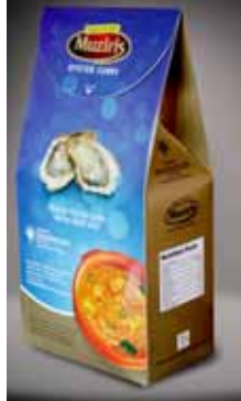
रिटार्टेबिल पॉउच में सीपी करी