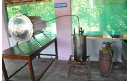
शुक्ति स्टीमर यंत्र