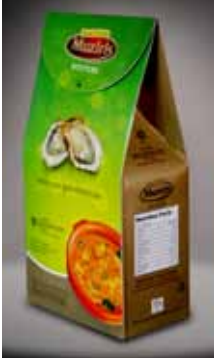
आइ क्यू एफ शुक्ति