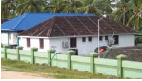
नारककल पर शक्ति हैचरी का दृश्य