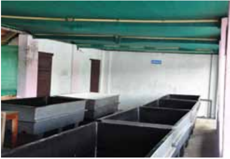
मृत्तकुत्रम पर स्थित शुक्ति मूल्य वर्धित उत्पादन इकाई का दृश्य