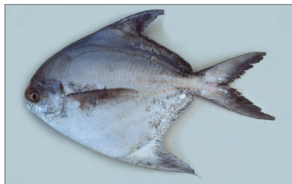
पाम्फेट पाम्पस चिनेनसिस

चीनी पोम्फेटों को मुंबई के ढालीय जलक्षेत्र में और कच की खाडी में 80 मी की गहराई में देखा जाता है। इसकी प्रचुरता वर्षा वर्ष बदलती रहती है और इस प्रकार की भारी पकड साधारण नहीं है, अतः प्रौढ नमूनों की इस प्रकार की अप्रत्याशित पकड की यह प्रथम रिपोर्ट है।