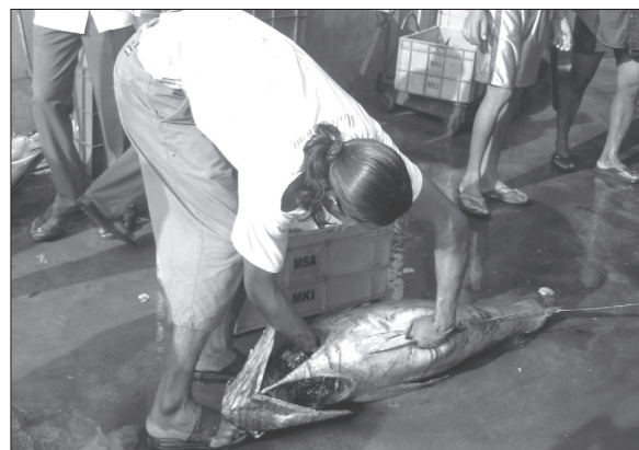
चित्र 2 पीतपख ट्यूना के क्लोम कर्षणियाँ और आंत्र निकालने का दृश्य

2009 जनवरी -मार्च के दौरान चेन्नई मात्स्यिकी पोताश्रय में पीतपख ट्यूना का भारी अवतरण देखा गया था। 3-3-2009 को 5.5 टन की अधिकतम पकड प्राप्त हुई थी। चेन्नई की उत्तर-पूर्वी दिशा में 80-120 मी की गहराई में काँटा डोरियों का प्रचालन किया गया था। पकड में 80-90% पीतपख ट्यूना थी और अन्य थी सेइलफिश, करंजिड, सुरमई और कलवा मछलियाँ। ट्यूना पकड को प्रति कि ग्रा 80 रु की दर पर नीलाम कर दिया गया। मछलियों को साफ करके क्लोम कर्षणियाँ और आंत्र निकाल दिया गया (चित्र - 2)। साफ की गयी मछलियों को उच्च मूल्य पर निर्यात करने के लिए केरल भेज दिया गया।