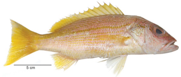
लूटजानस मड्रास (Valenciennes, 1831)