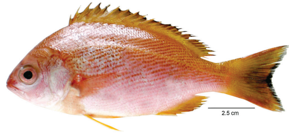
पिंजलो पिंजलो (Bleeker, 1850)