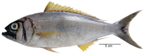
अफारियस फर्का (Lacepede, 1801)