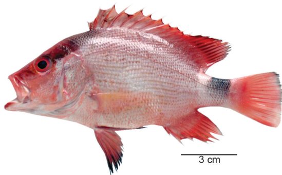
लूटजानस मोणोस्टिग्मा (Cuvier, 1828)