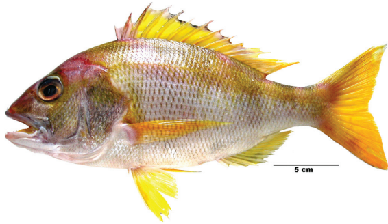
लिपोटीलस कार्नोसब्रम (Chan, 1970)