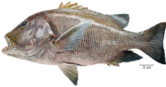
लुट्जानस रिबुलाटस (Cuvier, 1828)