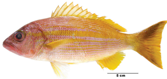
लूटजानस लूटजानस (Bloch 1790)