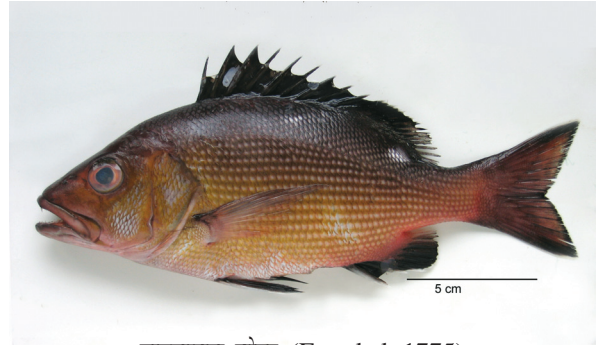
लूटजानस बोहर (Forsskal, 1775)