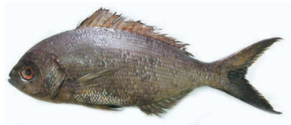
पारासिसियो सोरडिडा (Abe shinohara 1962)