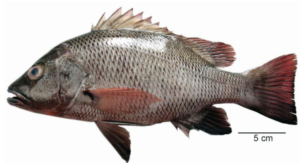
लूटजानस अर्जेटिमकुलाटस (Forsskal, 1775)