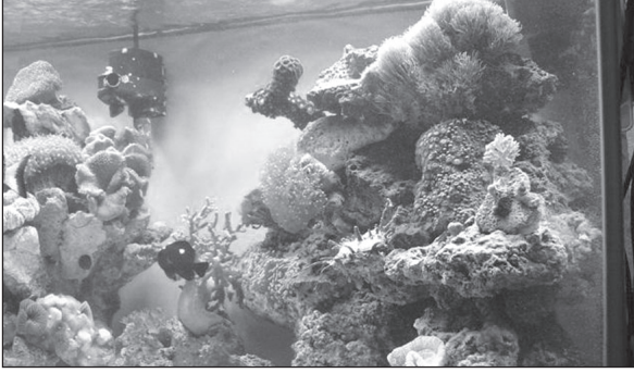
जलजीवशालाओं का आकर्षण-जिन्दा पत्थर

जलजीवशाला में बहुजातीय मछलियों के साथ लाइव रॉकों का अनुरक्षण और अनुवीक्षण करना मुश्किल का कार्य है। जलजीवशाला में स्थापित करने से पहले लाइव रॉक को अत्यंत सावधानी से संभालना है। सिर्फ देखकर छोड़ दिए जानेवाले जैव समृद्ध प्रवाल भित्ति जैसे लाइव रॉक को छोड़ देने से पहले गौर से देखना है। लक्षित जलजीवशाला में स्थापित किए जाने का भाग उसमें रहनेवाले जीवों और चारों ओर के धरातल को गड़बड़ करने के बिना सावधानी से निकालकर स्वच्छ समुद्र जल भरे टैंक में रखकर लक्षित स्थान तक परिवहन किया जाना है। अच्छी तरह वातन होनेवाले 500 लीटर धारिता के टैंक में ध्यान से रॉक को रखा जाना है। प्रतिदिन टैंक का 50% पानी बदलना है। इससे रॉक में संबद्धित बिलकारी जीवों की मृत्युता कम हो जाती है। केकड़ा जैसे परजीवों को टैंक से निकाल देना उचित होगा। अच्छी तरह प्रकाश मिलनेवाले स्थान में टैंक को रखा जाना है। टैंक के नितलस्थ भाग से मृत जीवों को निकाल देना है। खाद्य के रूप में नानोक्लोरोप्सिस या क्लोरेल्ला जैसे संबद्धित शैवाल प्रतिदिन (400 धारिता के टैंक में 30 लिटर की मात्रा में) उचित सांद्रता में दिया जाना है। ट्यूबवर्म, एकिनोइड्स जैसे संबद्ध जीवों को खाद्य के रूप में रोटिफरों को भी दिया जाना है।