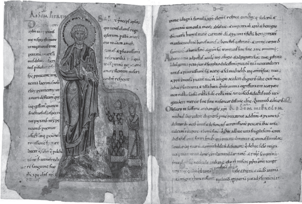
Псалтир Егберта, арк. 5v—6r

доповнень. Причому автор першої, будучи художником візантійського вишколу, імітував західні іконографічні зразки, а другий, навпаки, будучи західного походження, послуговувався візантійськими моделями. Щодо місця виконання, то окрім традиційних версій про Київ і волинські міста, в яких правив Ярополк, Е.С. Смирнова вказує на Туров, який також входив до Ярополкових володінь. Датування відповідно визначається на час правління Ярополка в цих містах, тобто між 1078 (роком смерті його батька Ізяслава) та 1085 (роком вигнання Ярополка і переїзду Гертруди до Києва). Символічне значення композицій Е.С. Смирнова інтерпретує у тісному зв'язку з іншими Гертрудиними доповненнями. Так, перша мініатюра (арк. 5v), на думку дослідниці, є візуалізацією молитов до апостола Петра, написаних обабіч зображення, а мініатюра на арк. 10v, яка зображає коронацію Ярополка, об'єднується в мініцикл з двома іншими, що їй передують (арк. 9v та 10r відповідно). Ці дві мініатюри, репрезентуючи Різдво Христове та Розп'яття, символізують початок і кінець Євангельської історії, а мініатюра з коронацією, оскільки містить образ Христа у Славі, відсилає до теми Старшого суда. Таким чином, виникає цикл, який оповідає про земний шлях Христа, Його жертву та спасіння, що гряде.