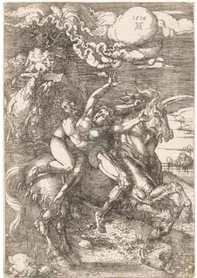
Kat. 2.4 Albrecht Dürer: Entführung auf dem Einhorn, 1516. Nürnberg, Germanisches Nationalmuseum

Unter den Fabeltieren zählt der Drache zu den bevorzugten dämonischen Tieren. Sagenhafte Helden und unbesiegbare Heilige aus allen Zeiten und allen Völkern kämpfen gegen sie: Herkules, Siegfried, Wigalois, die heilige Margareta, der heilige Georg und viele andere mehr. Das Motiv des Drachenkampfes ist kulturgeschichtliches Gemeingut. Im Abendland gilt der Drache gemeinhin als Personifikation des Bösen. Die Johannesoffenbarung schildert den Kampf zwischen dem Erzengel Michael und Satan, dem großen Drachen, nach dessen Niederlage der Teufel samt seinem Gefolge auf die Erde stürzt (Offb 12,7–9). Als Leviathan oder Midgardschlange windet er sich um die Erde und bildet der im Altertum verbreiteten Auffassung zufolge ihren