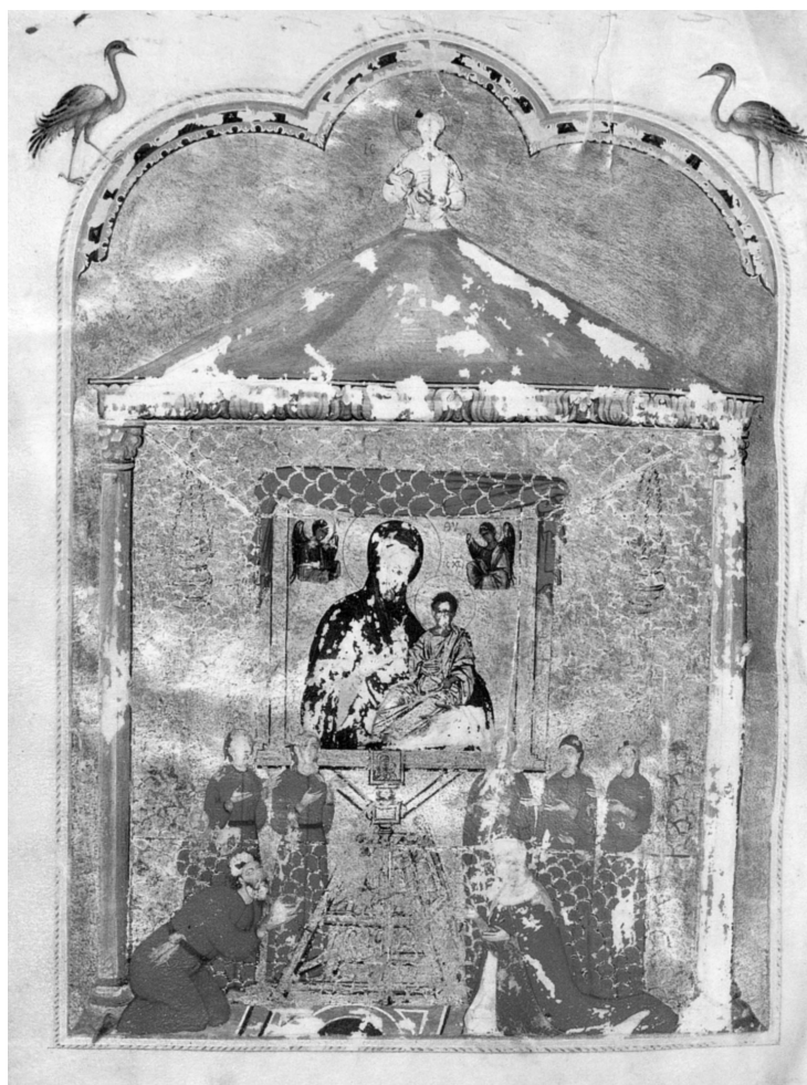
Святилище иконы Одигитрии. Миниатюра Псалтыри Гамильтона. XIII в. The Shrine of Hodegetria icon. A miniature of the Hamilton Psalter. 13 cent.

ся свв. Елена и Константин Великий по сторонам от реликвии Креста Господня.