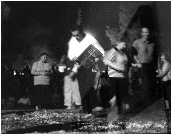
Танец на углях с иконой The dance with the holy icon on coals

для людей своего рода защитой. В понятиях иеротопии речь идет о создании перформативной иконы, образа-посредника, устанавливающего неразрывную связь земного и небесного, зримо представляющего чудо преображения, в котором реальное и мистическое переплетены до полной неразличимости. Библейская метафора «Божественного огня» приобретает в этом контексте психофизически ощутимую конкретность и при этом сохраняет силу иконического образа, так или иначе переживаемого всеми присутствующими.