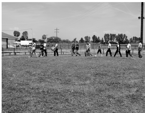
Иконы в огне. Византийская иеротопия обряда Анастасарии