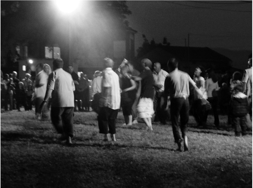
Танцы на углях. Dance on burning coals

С момента вручения святыни участники обряда преобразуются из обычных людей в своего рода медиумов, получая особую благодать, мистически соединяются со святыми и обретают способность к экстатическому танцу, который рассматривается как форма молитвы и обожения. Анастенариды повторяют специальные