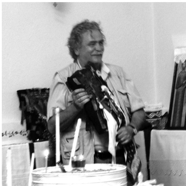
Верховный вручает икону для ритуального танца в конаки. The Archonastenerides gives the holy icon for a ritual dance

можно было бы опереться. Некоторые исследователи указывают на связь св. императора Константина Великого с солнечными культами, которые могли послужить основой обряда «огнехождения» 4 . В этой связи вспоминают имевший государственный статус культ бога солнца Гелиоса, гигантская статуя которого была установлена на колонне в центре Константинополя. Под видом солнечного божества почитался Константин Великий и даже сам Христос, поскольку в лучевой венце Гелиоса была вмонтирована великая реликвия Св. Гвоздя от Креста Господня, присланная императору его матерью св. Еленой из Иерусалима.