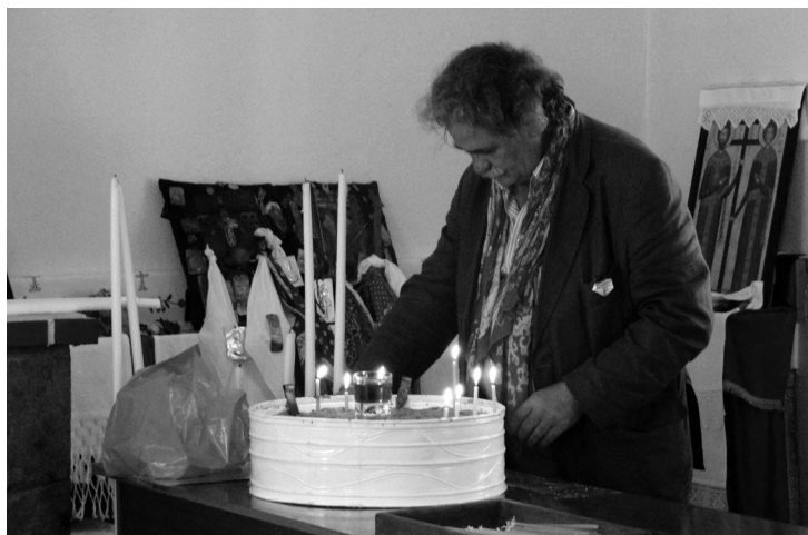
Верховный анастенид совершает световозжигание перед иконами-реликвиями. The Archanastenarides kindling the light before the Icons-Relics

зантийской иеротопии, которая сохранилась в формах живого современного обряда и находит удивительные параллели в восточно-христианских действиях с иконами, известных в иконографии и по описаниям в средневековых текстах 2 . Сопоставление ритуальной практики и средневековой традиции может существенно обогатить наши знания о византийской культуре и многое понять в ритуальной практике наших дней.