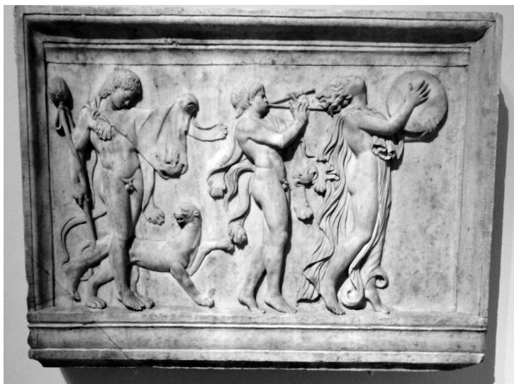
Иконы в огне. Византийская иеротопия обряда Анастенарии