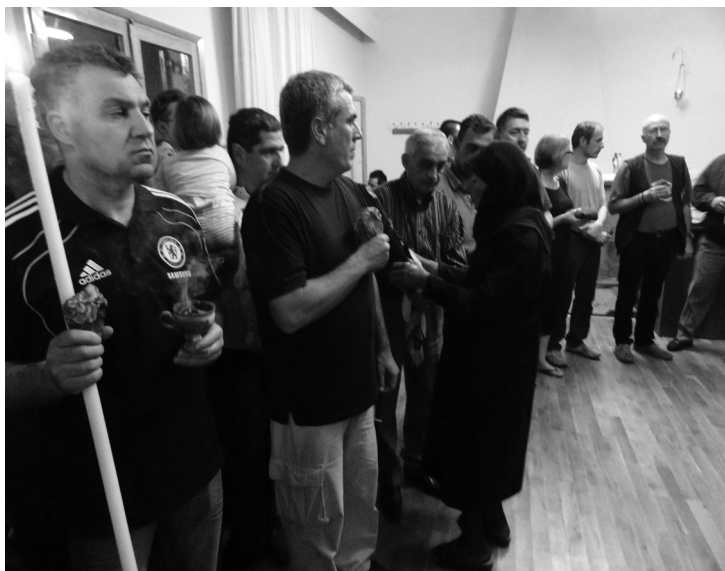
Анастенариды перед совершением обрядового танца. The anastenarides before the ritual dance

мым иконам с образами Свв. Константина и Елены по сторонам от Честного Креста Господня составляет сердцевину обряда. Они считаются великими реликвиями, конституирующими общину, и ясно отличаются от обычных икон с образами тех же святых, которые встречаются по соседству. Иконы не древние, конца XIX — первой половины XX вв. В одну из них врезана доска от более старой иконы, некогда спасенной в пожаре. Иконы хранятся по отдельности в двух частных домах-молельни. Каждый день обряда начинается и заканчивается с особой процессии торжественного принесения икон и установления их в «конаки», а затем возвращения на ночь в свои дома.