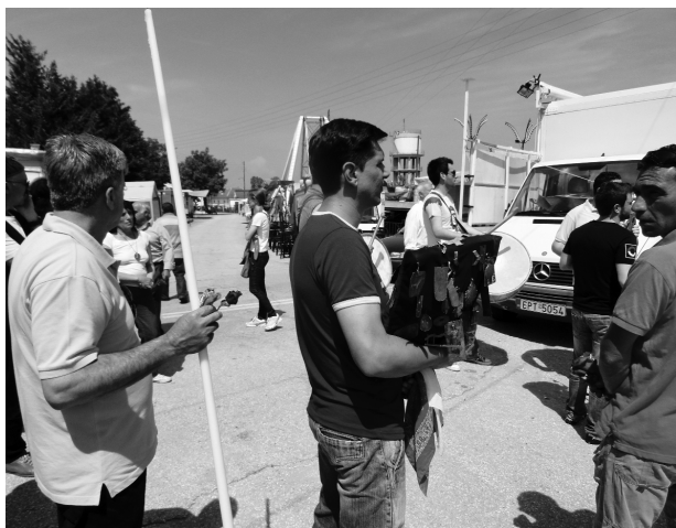
Процессия анастена- ридов. The Procession of anastenarides