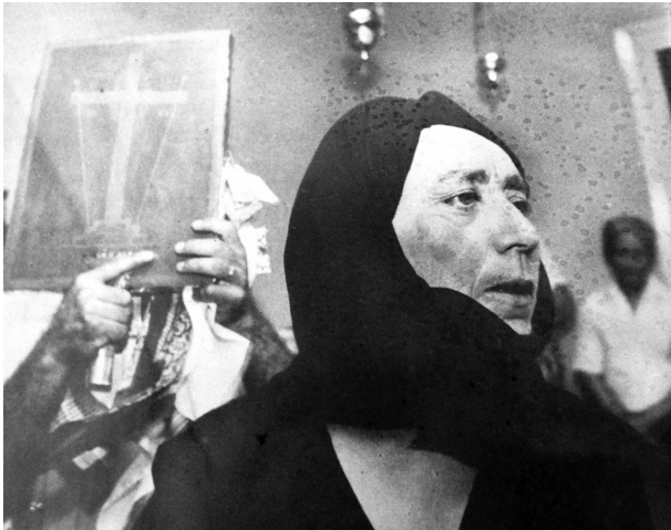
Геронтисса в танце The Gerontissa in dance

Иконы в ритуальном танце. Поклонение двум особо почитае-