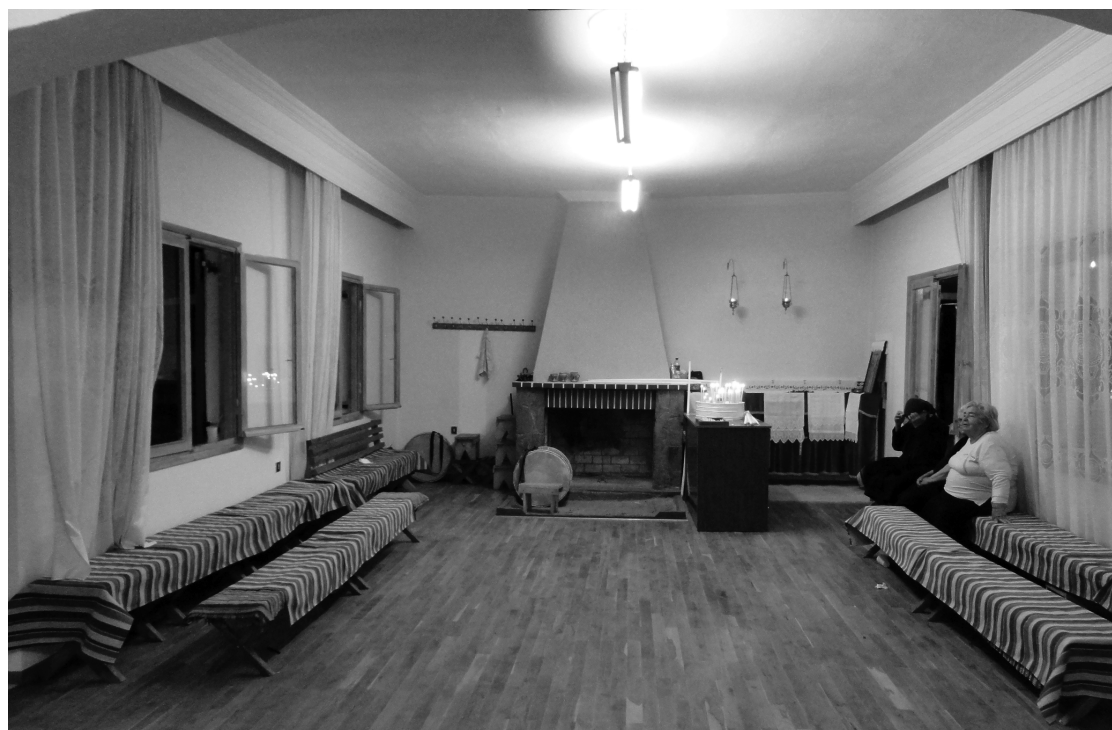
Конаки — зал священнодействий. The Konaki – a sacred hall