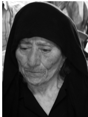
Иконы в огне. Византийская иеротопия обряда Анастенарии