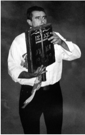
Анастенарид с иконой в руках An anastenarides carrying the holy icon

кроме того, христианское содержание представляется слишком значимым, чтобы служить лишь прикрытием языческой древности. Первое ясное описание обряда, как мы его знаем сегодня, относится к 1866 г. Но есть и свидетельства этнографического характера: так, обряд сохранился у греков, переселенных Николаем I в Крым в первой половине XIX в. (сейчас с. Чернополье около Симферополя).