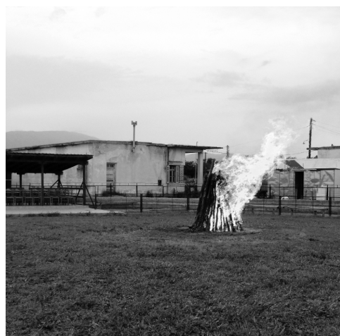
Поле с ритуальным костром для пригото- вления углей. The field with the ritual fire-place