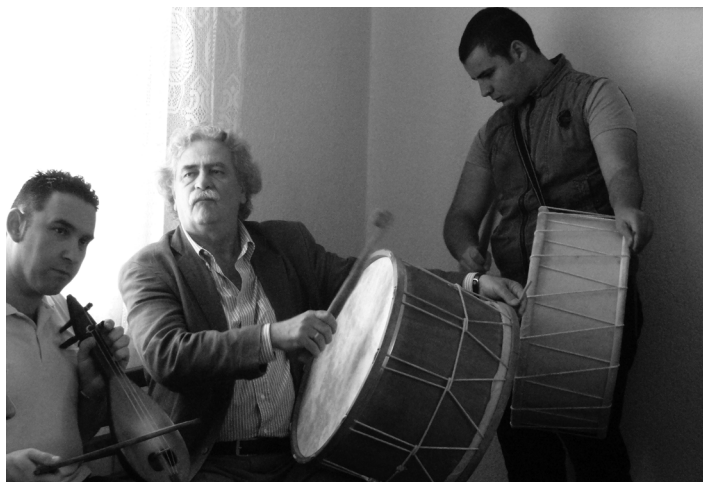
Священный оркестр. The Sacred Orchestra

при этом «хождение по углям» составляет менее 40 минут из более чем трех суток обрядового действия. Перечислим его основные элементы.