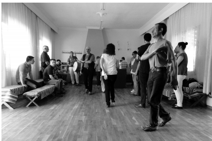
Иконы в огне. Византийская иеротопия обряда Анастенарии