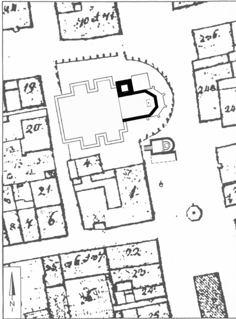
Abb. 1: Grundriss-Schema von Dominikus Zimmermanns erstem Langhausprojekt für die Schongauer Stadtpfarrkirche, maßstäblich eingepasst in den Urkataster von 1816 (Rekonstruktion von P. H. Jahn).