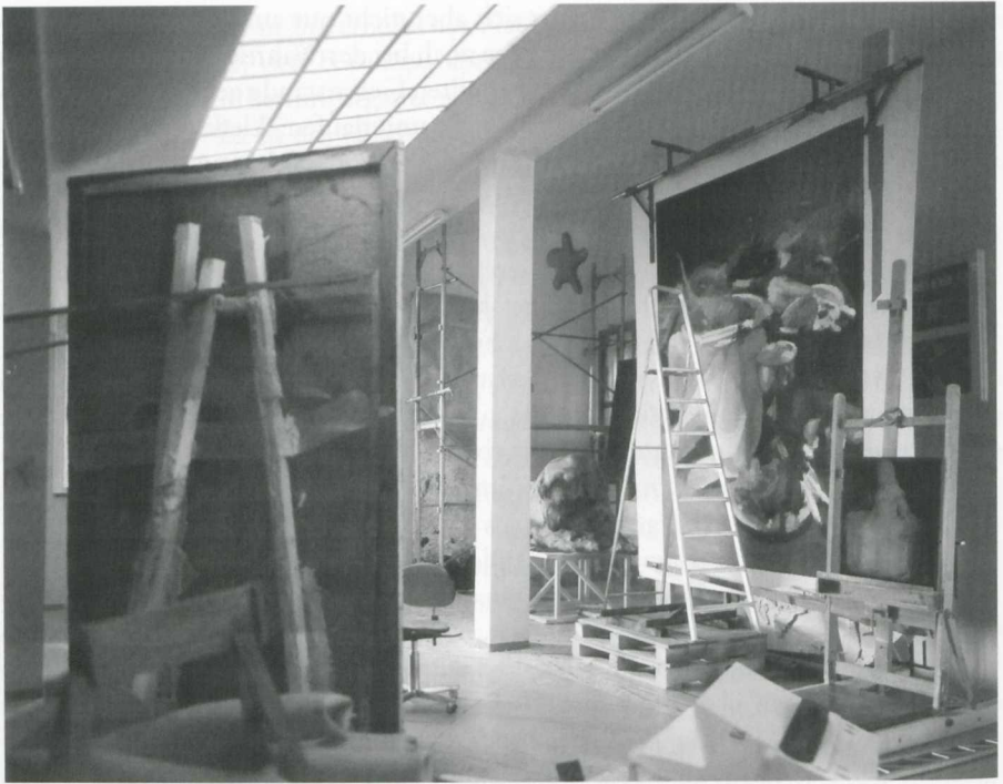
2. Lois Renner, Meniñas , 1992. Fotografie, 152 x 190 cm. Privatsammlung

tus der Fotografie, die er so gern als Malerei verstanden wissen möchte? Ich möchte diese Fragen unter Einbeziehung eines weiteren Werks beantworten, und zwar der Meniñas 18 von 1992 (Abb. 2), die den Dialog von Malerei und Fotografie noch auf einer weiteren Ebene inszenieren. Denn dieses Werk rekurriert nicht nur im Titel auf Velázquez' Inkunabel neuzeitlicher Atelierdarstellungen im Typus des Künstlers bei der Arbeit an seinem Werk, 19 auch die Raumaufteilung verweist auf Velázquez' Arbeitsraum, und zwar durch die Übernahme der monumentalen Leinwand im linken Bildvordergrund, die uns Velázquez nur in Rückansicht präsentiert und von der wir bekanntlich nicht wissen, was für ein Bild sie trägt. »Woran arbeitet Velázquez?« lautet die Frage, um deren Beantwortung sich die kunsthistorische Forschung bekannt-