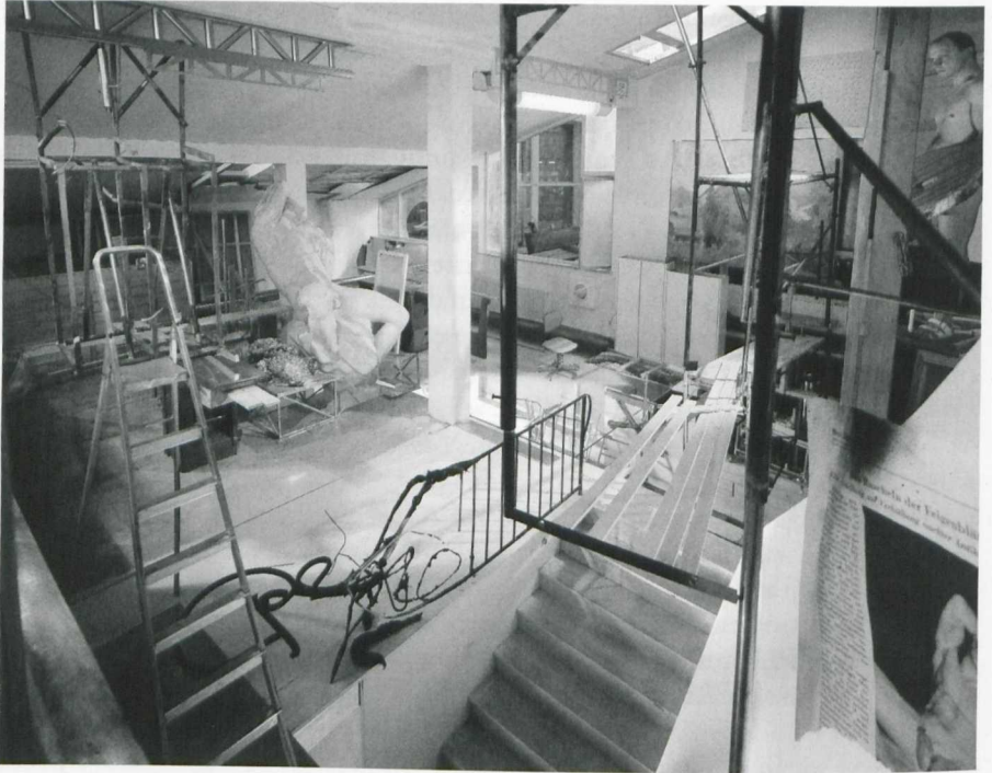
1. Lois Renner, Barberinischer Faun 3000, 2000. Fotografie, 285,5 x 350 cm. museum kunst palast, Düsseldorf

Kunstwerk zueinander erweckt er den Eindruck, eine spezifische Ateliersituation – der Künstler bei der Arbeit an seinem Werk – wiederzugeben und damit szenisch-narrativ strukturiert zu sein. Daher sei zunächst eine Lektüre in diesem Sinne versucht. 8