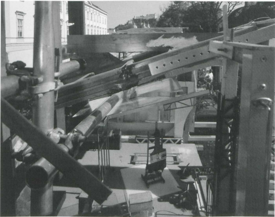
3. Lois Renner, Mirabellgarten , 1999. Fotografie, 152 x 190 cm. Privatsammlung

forciert dies noch, wenn er dabei innerbildlich die handwerkliche Komponente des »Bildermachens« herausstellt. Denn nicht nur verweisen die zahlreichen Gerüste, die in seinen Modellen herumliegen, aber nicht durch die Geschehenslogik der Sujets erforderlich sind, metaphorisch auf diese zeitaufwendige und akribische »Arbeit« am Bild, er konnotiert auch die Tätigkeit des Malers im Atelier handwerklich und hebt hierdurch auf die Doppelbedeutung von »Malen« ab. So steht er in Klass/Super 38 von 1991, das er rückwirkend als sein erstes Werk bezeichnet, hinter einer großen Lache ausgekippter Farbe industrieller Fertigung und trägt einen selbstgebastelten Zeitungshut, in Das Schaf (1991) 39 ist eine für das Anstreichen von Wänden benutzte Farbwalze im Atelier »monumental« aufgebockt, im Zentrum von Mirabellgarten (1999; Abb. 3) 40 liegt ein breiter Pinsel, wie er für das Auftragen von Lackfarbe benutzt wird, und in Lindgrünes Baugerüst (1992; Abb. 4) 41 stehen zwei große bemalte Holztafeln, bei denen es sich um abstrakte Gemälde zu