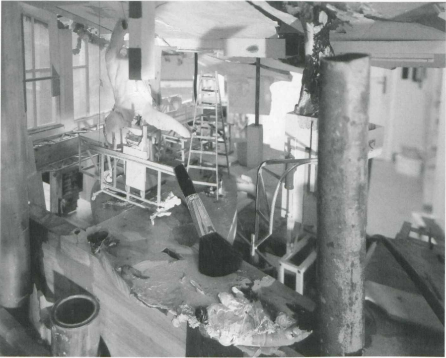
6. Lois Renner, Der Faun im Atelier , 1997. Fotografie, 180 x 225 cm. Hessische Landesbank, Frankfurt a.M

verer Betrachtung der Bilder früher oder später durchschaubar und damit thematisch. Renner erzeugt diese »Ent-Täuschung« des Betrachters mittels der oben als »Fiktionssignale« bezeichneten Indikatoren der Artifizialität, die er spielerisch variiert: So sind die Steckdose im Barberinischen Faun (Abb.1) oder das Bic-Feuerzeug in Gerüst 51 veritable Fiktionssignale, weil dem Betrachter ihre Größe in Relation zu anderen Objekten der Dingwelt bewußt ist. Weil er metaphorisch auf die Maßverhältnisse verweist, hat der im Bildvordergrund von Atelier (Parterre) (Abb. 5) 52 abgelegte aufgefächerte Zollstock geradezu selbstbezüglichen Charakter. Die Palette mit Schminkpinsel in Der Faun im Atelier (1997; Abb. 6) 53 spielt auf die originär antike Analogisierung von Farbe und Schminke, und damit als ein lügnisches,