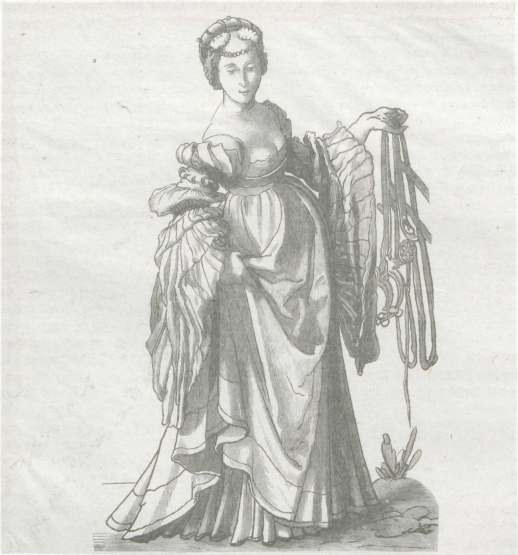
Temperantia. Getuschte Federzeichnung von H. Holbein d. J.