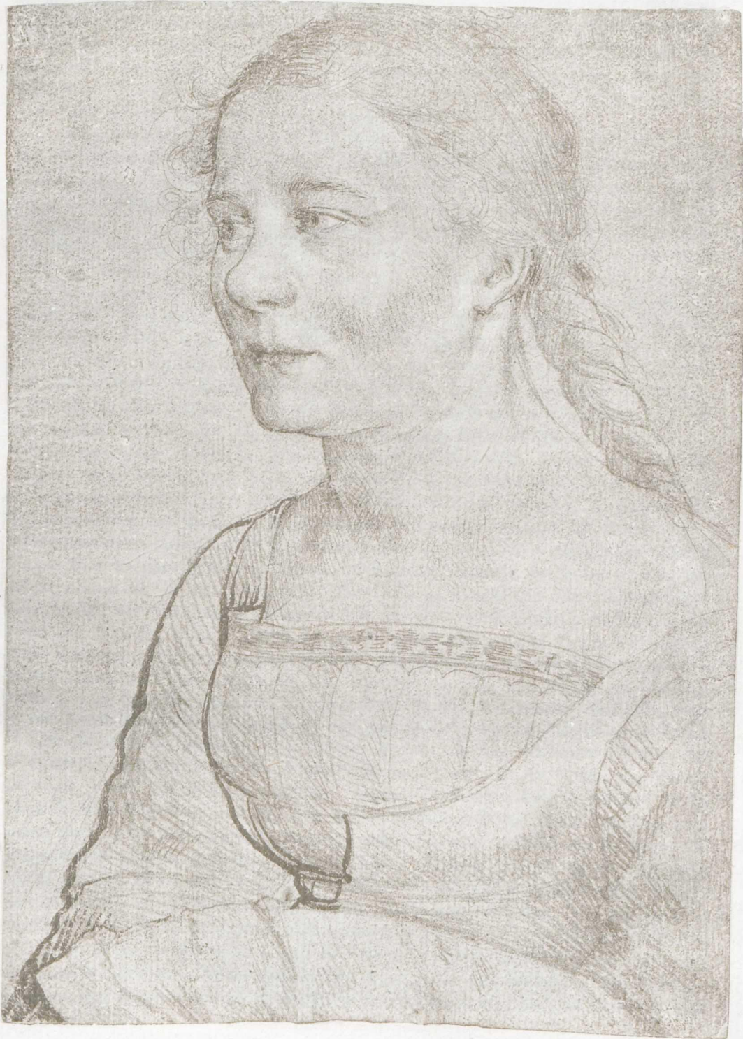
BILDNISS EINES JUNGEN MÄDCHENS METALLSTIFTZEICHNUNG