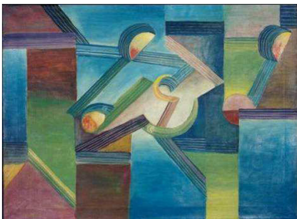
Abb. 4: Wolfgang Beltracchi: Komposition (Frauenmond III) , Fälschung nach Johannes Molzahn (1920), ca. 1985