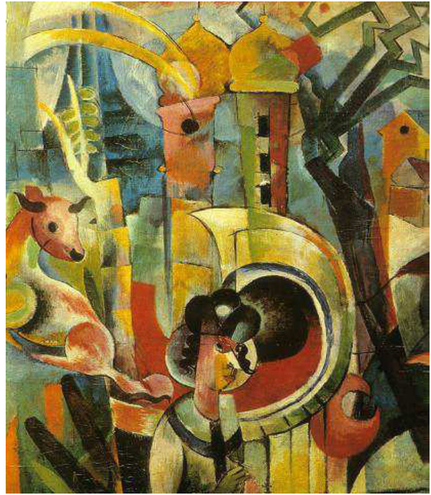
Abb. 7: Heinrich Campendonk: Bayerische Landschaft , 1913, Kaiser-Wilhelm-Museum, Krefeld

Negation ist somit Selbstzweck und nicht performatives Erleben des Selbst im Anderen im Zuge der Werkgenese wie bei Turk. Zudem fußt der Gestus der Überbietung und Weiterführung des Künstlereoewres auf dem entscheidenden Vorteil Beltracchis, dass er im Gegensatz zum Künstler selbst sowohl den Verlauf der Historie als auch die mit den Jahren sich wandelnde Rezeption des Künstlers und seines Werks kennt. Mit dem panoptischen Blick der zeitlichen Distanz konnte Beltracchi somit dezidiert Lücken im Oeuvre des Künstlers aufspüren und eventuell unvollendete Stränge weiterführen. Diese Kombination aus intensivem Einfühlungsvermögen, fundierter Kenntnis der Historie und der Künstlerbiografie aber auch der Desiderate des Marktes und der Forschung macht Fälschungen im Allgemeinen und die Beltracchis im Besonderen geradezu unwiderstehlich, da sie nicht nur das Original in Teilen zu simulieren vermögen, sondern dieses zugleich dem zeitgenössischen Geschmack und Forschungsstand anpassen. Fälschungen bereinigen Originale geradezu vom Ballast der