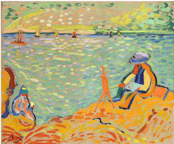
Abb. 1: Wolfgang Beltracchi: Matisse peignant, Fälschung nach André Derain, 2004

chis nach Max Pechstein, die in Form eines Medienwechsels Zeichnungen des Künstlers, die als original anerkannt sind, in vermeintliche Gemälde überführten. Im Falle der Fälschung „Liegender Akt mit Katze“ etwa diente die Kreidezeichnung zum einen als Provenienz, indem man das nun entdeckte Ölgemälde aus der bereits existierenden Zeichnung hinsichtlich der Motivähnlichkeit ableitete und legitimierte. Zum anderen fand jedoch eine Aufwertung des Gemäldes und eine Abwertung der Zeichnung statt, da diese nun lediglich als Vorstudie zu dem eigentlichen in Öl gearbeiteten Werk rezipiert wurde. In der Fälschung „Matisse peignant“ nach André Derain fällt weiterhin ein zwar zunächst ungenau wirkender Duktus auf, dieser ist allerdings derart überzogen, dass gerade dadurch eine Rückkopplung auf die originale Zeichnung möglich wird. 22