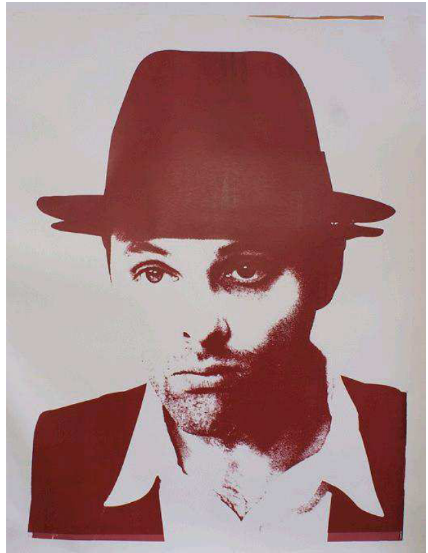
Abb. 3: Gavin Turk: Beuys Red , gedruckt im Stil der Siebdrucke Andy Warhols, 2009

lersignatur führt. So hat Djordjevic das Stadium der Rezeption und aemulativen Weiterverarbeitung literarischer Vorbilder längst überwunden, wenn er Schriften als und im Namen von Walter Benjamin verfasst. Turk hingegen wiederholt beispielsweise Arbeiten Andy Warhols bis hin zur Signatur oder er überformt das Gesicht Joseph Beuys derart, dass er sowohl psychisch als auch physisch qua seines Gesichtes in seinem künstlerischen Vorbild aufgeht.