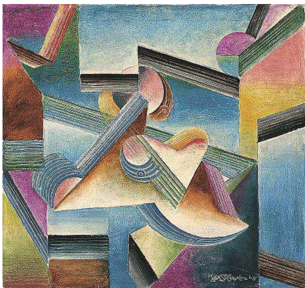
Abb. 5: Johannes Molzahn: Frauenmond II , 1920, Kunstforum Ostdeutsche Galerie, Regensburg, Leihgabe der Bundesrepublik Deutschland

Beltracchi oszilliert folglich zwischen den Polen der imitatio und aemulatio , zwischen Reproduktion und Produktion und zielt dabei auf eine superatio , die sich entweder als stilzitierende Totalfälschung im Gewand einer Neuschöpfung oder als Adaption manifestiert. Betrachtet man Beltracchis Methodik des Aufgreifens, Variierens und Zitierens, so wird gerade der Begriff der Adaption diesem