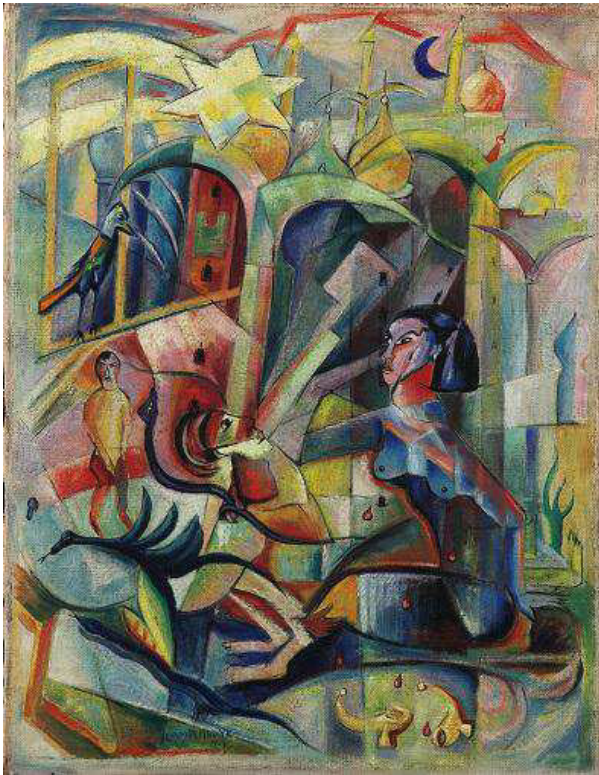
Abb. 6: Wolfgang Beltracchi: Else Lasker-Schüler gewidmet , Fälschung nach Heinrich Campendonk (1914), ca. 2000

Negation ist somit Selbstzweck und nicht performatives Erleben des Selbst im Anderen im Zuge der Werkgenese wie bei Turk. Zudem fußt der Gestus der Überbietung und Weiterführung des Künstlereoewres auf dem entscheidenden Vorteil Beltracchis, dass er im Gegensatz zum Künstler selbst sowohl den Verlauf der Historie als auch die mit den Jahren sich wandelnde Rezeption des Künstlers und seines Werks kennt. Mit dem panoptischen Blick der zeitlichen Distanz konnte Beltracchi somit dezidiert Lücken im Oeuvre des Künstlers aufspüren und eventuell unvollendete Stränge weiterführen. Diese Kombination aus intensivem Einfühlungsvermögen, fundierter Kenntnis der Historie und der Künstlerbiografie aber auch der Desiderate des Marktes und der Forschung macht Fälschungen im Allgemeinen und die Beltracchis im Besonderen geradezu unwiderstehlich, da sie nicht nur das Original in Teilen zu simulieren vermögen, sondern dieses zugleich dem zeitgenössischen Geschmack und Forschungsstand anpassen. Fälschungen bereinigen Originale geradezu vom Ballast der