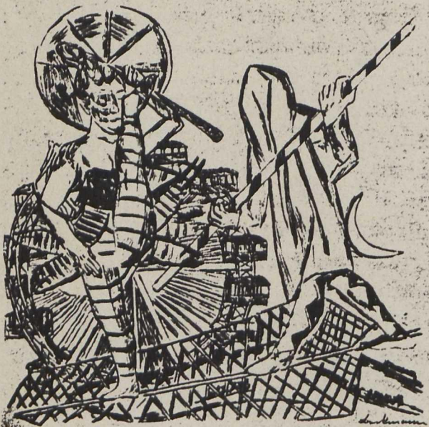
1 Max Beckmann, Die Seiltänzer, 1921, Kaltnadelradierung

Nach Rembrandt und neben Munch gehörte Beckmann zu den leidenschaftlichsten Selbstdarstellern der expressionistischen Moderne, und von Beginn an – um 1903 – standen schwarz-weiße Selbstporträts als Handzeichnungen und in grafischen Techniken (Lithographie, Radierung) nicht nur neben den farbigen Ölgemälden, sondern zumeist auch vor ihnen. Natürlich gab es bei ihm grafische Selbstbildnisse, die zwischen den Gemälden entstanden, wie die Radierung von 1921 mit Melone, der Holzschnitt von 1922 oder wie das meisterhafte Litho von 1911, das innerhalb des Frühwerkes vor dem Ersten Weltkrieg die Traditionsanbindung Beckmanns an die Kunst Rembrandts beeindruckend präsentierte (Abb. 2). 1 In der theoretischen Kon-