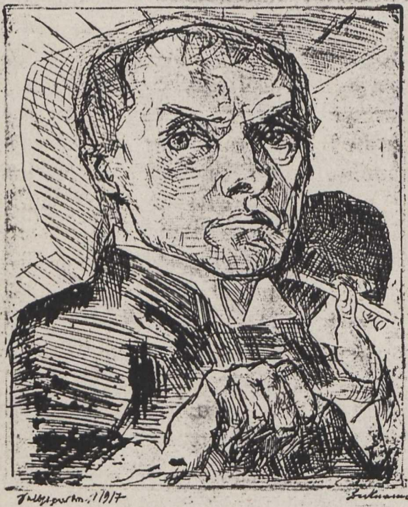
3 Max Beckmann, Selbstbildnis (aus der Mappe: Gesichter), 1917, Radierung

Der großartige Holzschnitt von 1922 (Abb. 4) in seiner bildnerischen Rolle und Signifikanz für die Stilwandlung zu 1924/25, d.h. größere Flächen, Abrücken von