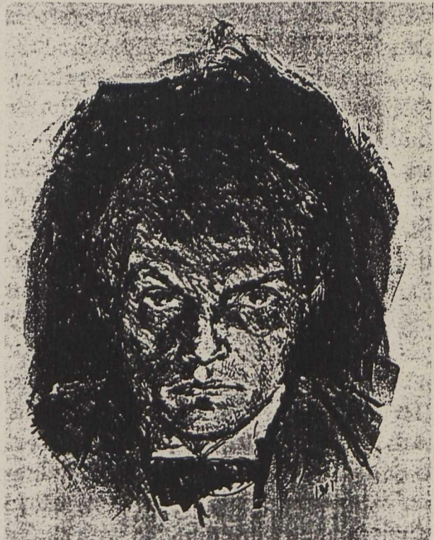
2 Max Beckmann, Selbstbildnis, 1911, Lithographie