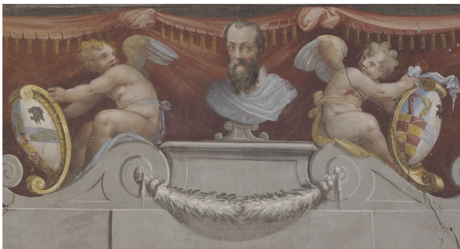
Firenze, Casa Vasari, Portrait of Giorgio Vasari with family coats-of-arms