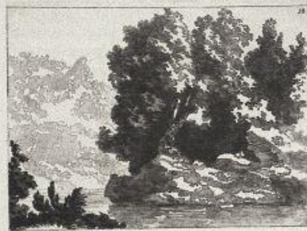
Alexander Cozens, [Blot], Aquatinta, 24 x 31,5 cm, aus: Cozens 1785, Pl. 38, British Museum, London

schatten gehalten. Rubens scheint eher mehr als ein Viertel Licht zugelassen zu haben, Rembrandt deutlich weniger, knapp ein Achtel.« 10 Derartige Nachzeichnungen des Helldunkels haben sich in einem italienischen Skizzenbuch Reynolds erhalten. Seine hier abgebildete Kompositionsskizze gibt sich bei genauerem Hinsehen als Wiedergabe von Tintoretts Wunder der heiligen Agnes zu erkennen.