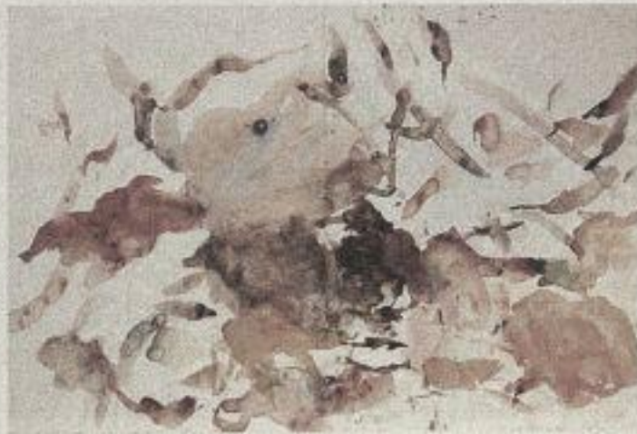
Gustave Moreau, Vorder- und Rückseite einer Aquarellpalette, 1880er oder 1890er Jahre, Pinsel und Flecken in Aquarell, 13,5 x 20 cm, Musée Gustave Moreau, Paris, 16010-239