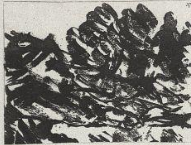
Alexander Cozens, [Blot], Aquatinta, 24 x 31,5 cm, aus: Cozens 1785, Pl. 37, British Museum, London

Diese rein formale und explizit gegenstandsunabhängige Definition der Bildkomposition war nicht nur für die Theorie relevant. Sie entspricht einer Form der Bildbetrachtung, die im 18. Jahrhundert mehrfach belegt ist. So schreibt der Maler Joshua Reynolds (1723–1792): »Als ich in Venedig war [im Jahr 1752], habe ich folgende Methode verwendet, um die Kompositionsprinzipien [der Venezianischen Maler] zu verstehen. Wenn ich in einem Bild eine außerordentliche Wirkung des Helldunkels beobachtete, nahm ich ein Blatt meines Skizzenbuches und verdunkelte jeden Teil in demselben Grad von Hell und Dunkel wie in dem Bild. Das weiße Papier blieb unberührt, damit es das Licht darstelle. Das Sujet des Bildes und die Figuren beachtete ich dabei nicht. Wenige Versuche reichten, um die Helldunkel-Führung zu begreifen. Nach einigen Experimenten fand ich heraus, dass meine Blätter alle auf vergleichbare Weise gefleckt [»blotted«] waren: Normalerweise wurde nicht mehr als ein Viertel des Bildes für das Licht gelassen, was primäre und sekundäre Lichter einschloss. Ein weiteres Viertel sollte so dunkel wie möglich sein. Die übrige Hälfte wurde in modulierten Halb-