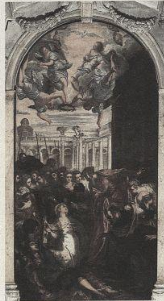
Jacopo Tintoretto, Wunder der heiligen Agnes, um 1563, 400 x 200 cm, Madonna dell'Orto, Venedig

ble«) 12 in quantitativer und qualitativer Hinsicht. Positiv bewertet er Bilder, die einen starken Eindruck hervorrufen, negativ dagegen jene, die den Betrachter kalt lassen. Der starke Eindruck kann sehr verschiedene Qualitäten haben. Beispielhaft zählt Laugier auf: Größe und Pracht, Schrecken, Liebreiz, Wonne, Unruhe, Einfachheit, Verachtung. 13