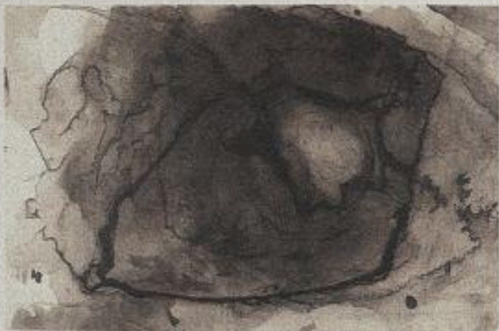
Victor Hugo, Ohne Titel, vermutlich 1850, braune Tinte auf Papier, 28,5 x 44,5 cm, Musée des Beaux-Arts, Dijon, DG 624