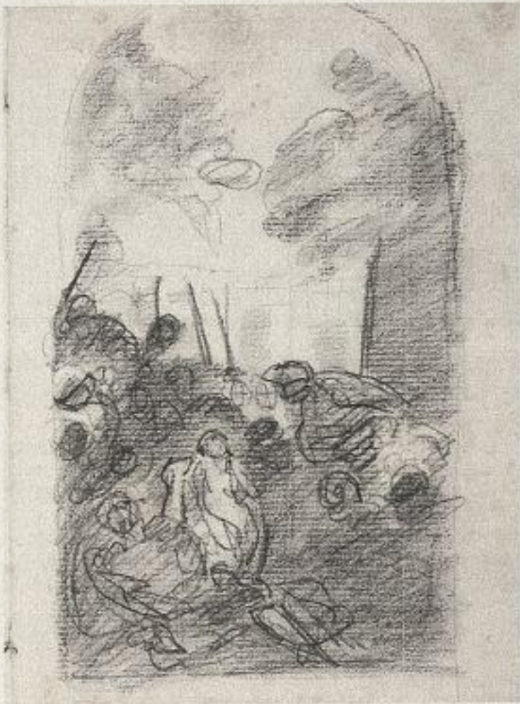
Joshua Reynolds, Kompositionsskizze (Tintoretto's »Wunder der heiligen Agnes«), 1752, Schwarzer Stift auf Papier, 21 x 15,8 cm, Skizzenbuch 201.a.g, f. 66., British Museum, London