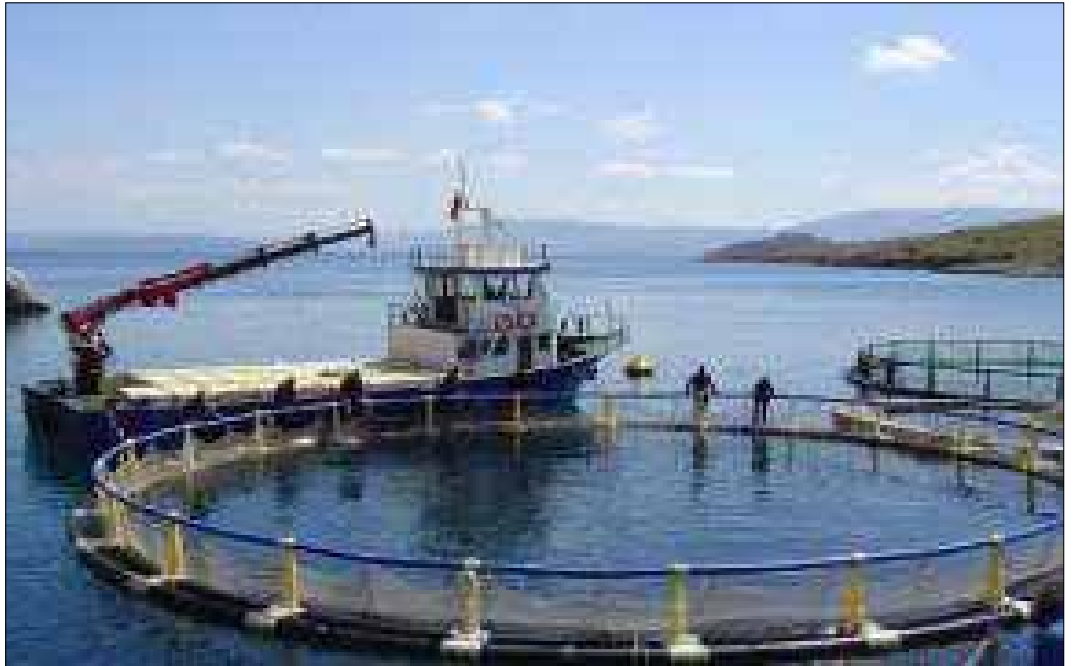
एकीकृत बहु पोषण जलकृषि

हैं। किसानों की अकार्बनिक दोहन के साथ संयुक्त भोजन जलीय कृषि (जैसे, मछली , झींगा, समुद्री शैवाल) और जैविक निष्कर्षण (जैसे, शंख ), जलीय कृषि पर्यावरण सुधार (biomitigation), आर्थिक स्थिरता (सुधार उत्पादन, कम लागत, उत्पाद विविधीकरण और जोखिम में कमी) और सामाजिक स्वीकार्यता (बेहतर प्रबंधन के