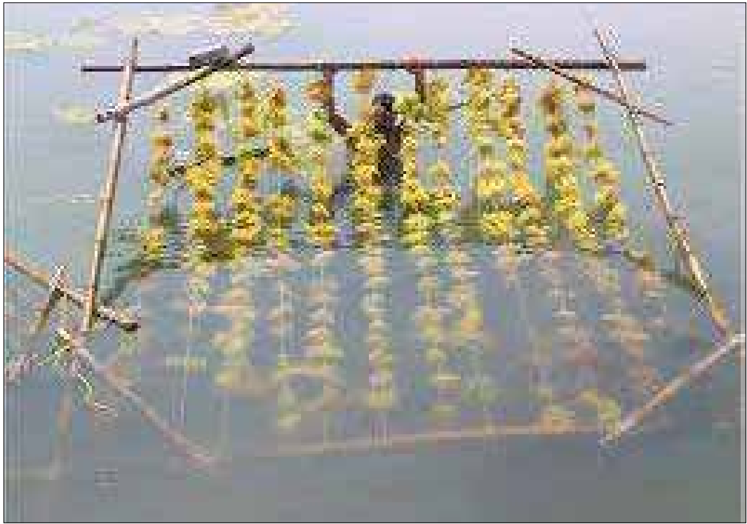
एकल रस्सी तैरता बेड़ा पालन

है। एक पत्थर एक ऊर्ध्वाधर स्थिति में रखने के लिए खेती की रस्सी के निचले सिरे से जोड़ा जाता है। आम तौर पर ग्रेसिलेरिया इडुलिस के 10 टुकड़े प्रत्येक रस्सी पर रखे जाते हैं। दो बेड़े के बीच की दूरी 2 मीटर पर रखी जाती है। तैरता बेड़ा तकनीक की खेती को केरल के तट पर इस्तेमाल करने की सिफारिश की गई है। कच्छ की खाड़ी में कुछ क्षेत्रों को गहरे पानी की समुद्री शैवाल की खेती के लिए उपयुक्त माना गया है।