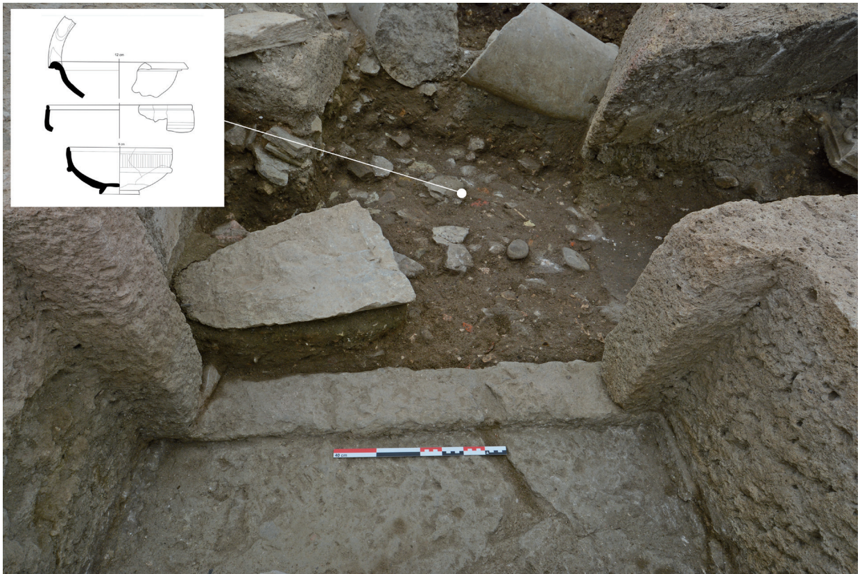
FIG. 6. Umbral de acceso al acotado funerario; bajo el derrumbe se observan los niveles de uso y de abandono.