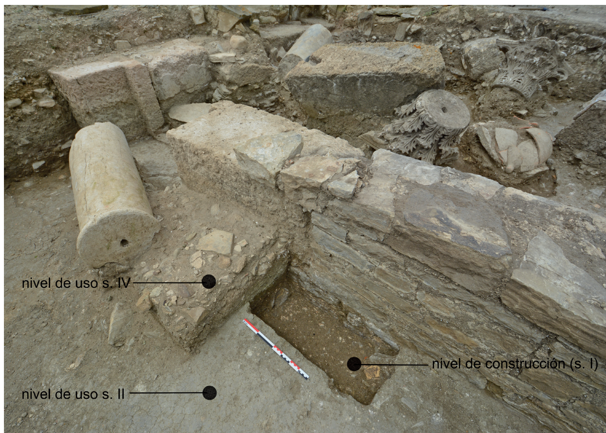
FIG. 5. Excavación del exterior del acotado funerario de la T-32 y fases.

La intervención conjunta de los dos mausoleos y del diverticulum que los separa permitió, como hemos adelantado, correlacionar estratigráficamente estas construcciones, al tiempo que se pudieron insertar dentro del complejo urbano extramuros (Fig. 5). La estructura localizada no solo se componía del mausoleo en sí, visible de inicio, como hemos dicho, sino de un muro que, partiendo desde el mismo monumento, dibujaba un acotado funerario de planta cuadrada. Sobre este muro, de 60 cm de anchura y 1 m de altura máxima conservada, se abría una puerta, bien delimitada por dos jambas y un umbral monolítico, que facilitaba su acceso desde el este, es decir, desde el diverticulum .