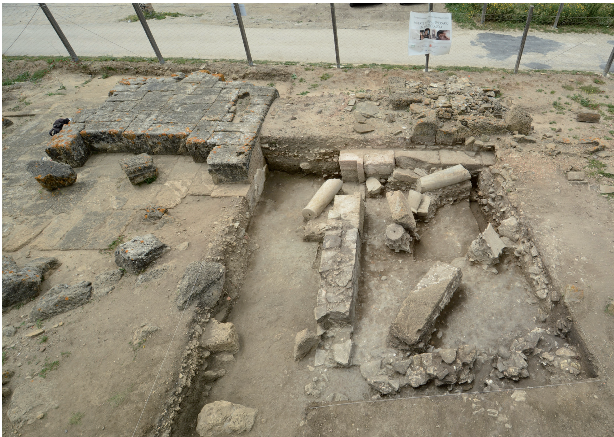
FIG. 3. Vista oblicua del área de intervención; en el centro, el diverticulum .

El mausoleo T-31 se intervino parcialmente. Antes de plantear la excavación se observaba un basamento de sillares de biocalcarenita muy expoliado, de más de 15 x 15 m de superficie, totalmente desprovisto de elementos decorativos, aunque arrumbados al pie se advertían algunos bloques de esquina con restos muy erosionados de pilastras. En la parte superior se había tallado un sepulcro antropomorfo que había sido dibujado por G. Bonsor (Paris et al. , 1926: 99). Este hecho aportaba una información relevante: en época tardoantigua o medieval el mausoleo ya estaba en el mismo estado en que lo encontramos en la actualidad, luego su destrucción y expolio fue necesariamente anterior. En el