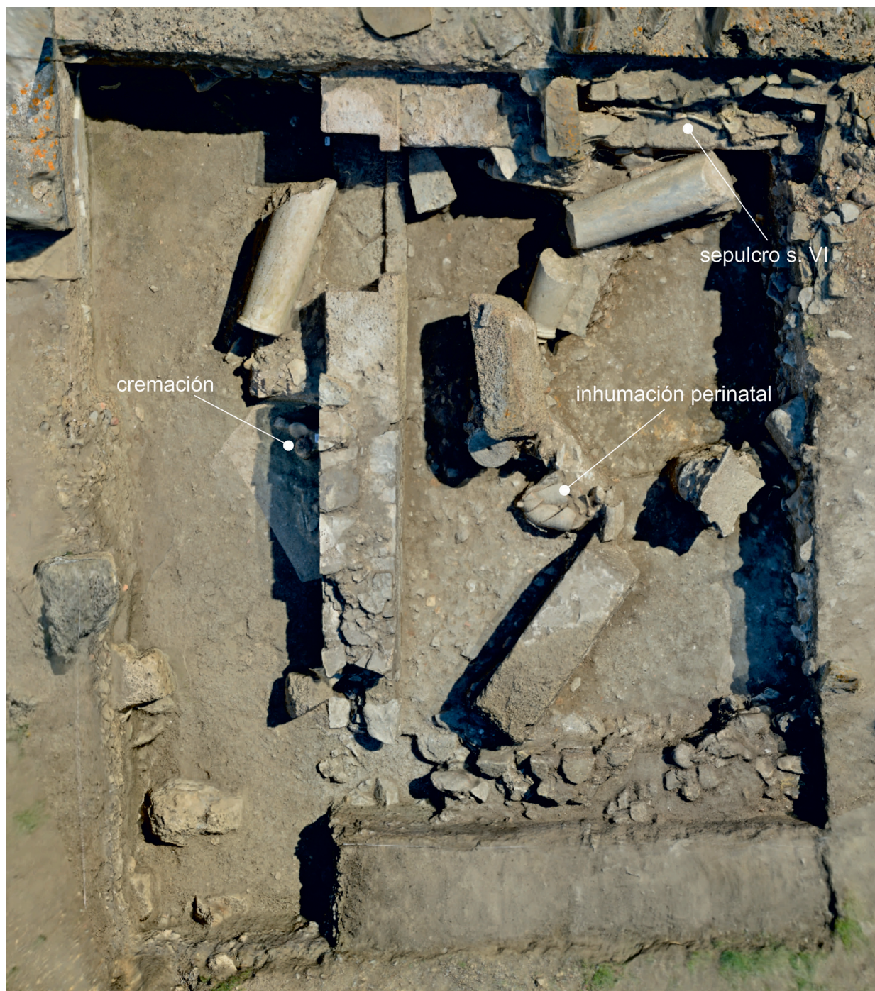
FIG. 9. Ortofoto del área excavada de la T-32.

La ausencia de molduras, tegulae o material latericio, nos indica que no existió una cubierta sobre el arquitrabe ni un frontón, y por ello proponemos