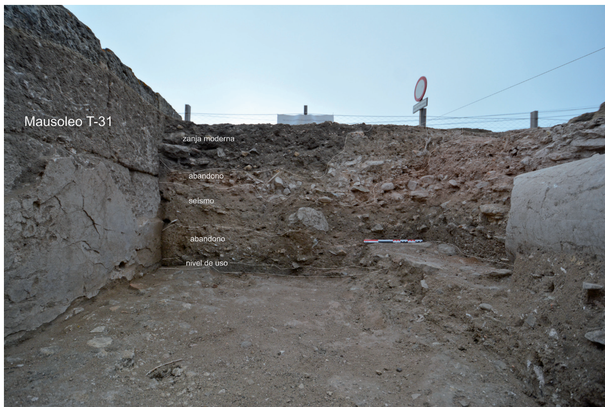
FIG. 4. Perfil estratigráfico sur del diverticulum , entre los dos mausoleos.

citado volumen los excavadores aluden a que este mausoleo “... qui remontait à une bonne époque, au temps de Claude ou Trajan, est rectangulaire, orné de pilastres cannelés et de chapiteaux corinthiens...”, lo que es muy interesante, aunque ya no queda rastro de los citados capiteles. La parte posterior del edificio no pudo ser excavada al quedar por debajo del recinto acotado del yacimiento y de la carretera actual que da servicio a los restaurantes. La intervención en su parte anterior permitió, en cambio, documentar numerosos elementos arquitectónicos, cornisas, pilastras y restos de su estucado. Pero esta zona delantera está muy alterada y erosionada, y no se ha documentado cultura material mueble asociada. Esta es la razón por la que decidimos concentrarnos en el espacio que separa ambos mausoleos.