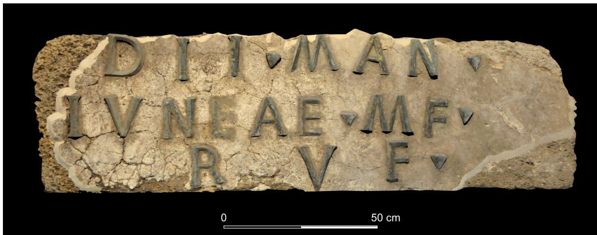
FIG. 11. Epígrafe de Iunia Rufina.

Las letras son de buena calidad y dispuestas con orden, aunque su ordinatio deje traslucir irregularidades. Unas están ligeramente fuera de sitio –caso de las dos M , de la A de MAN y de la F de RVF , siendo este último el más destacado); otras están