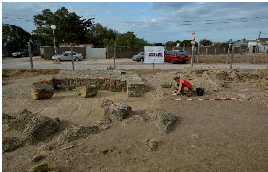
FIG. 2. Parte visible de los mausoleos al inicio de la intervención arqueológica.

tumbas desaparecidas, excavadas o cubiertas por el paso del tiempo, así como las exhumadas en épocas recientes (Prados, 2015). En el último lustro, en cambio, se abrieron nuevas zonas, documentando sepulcros inéditos y una vía funeraria, cuyo registro ha sido fundamental para reconstruir el paisaje funerario y establecer la primera secuencia estratigráfica de la necrópolis (Prados y Jiménez, 2016).