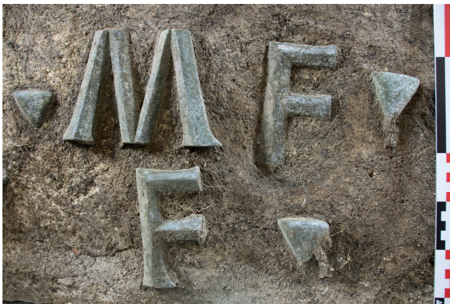
FIG. 12. Detalle de la reutilización de letras: abajo se observa una letra F original y arriba otra realizada a partir del estucado parcial de una letra E.

Lo más curioso e interesante es el hecho de que dos de estas letras, la segunda I de IVNIAE y la F de MF , no son en realidad ni una I ni una F sino dos E, algunos de cuyos trazos horizontales han sido tapados, de manera deliberada, con la capa de enlucido; mediante la ocultación de los tres trazos horizontales en el primer caso 5 , y del trazo inferior en el