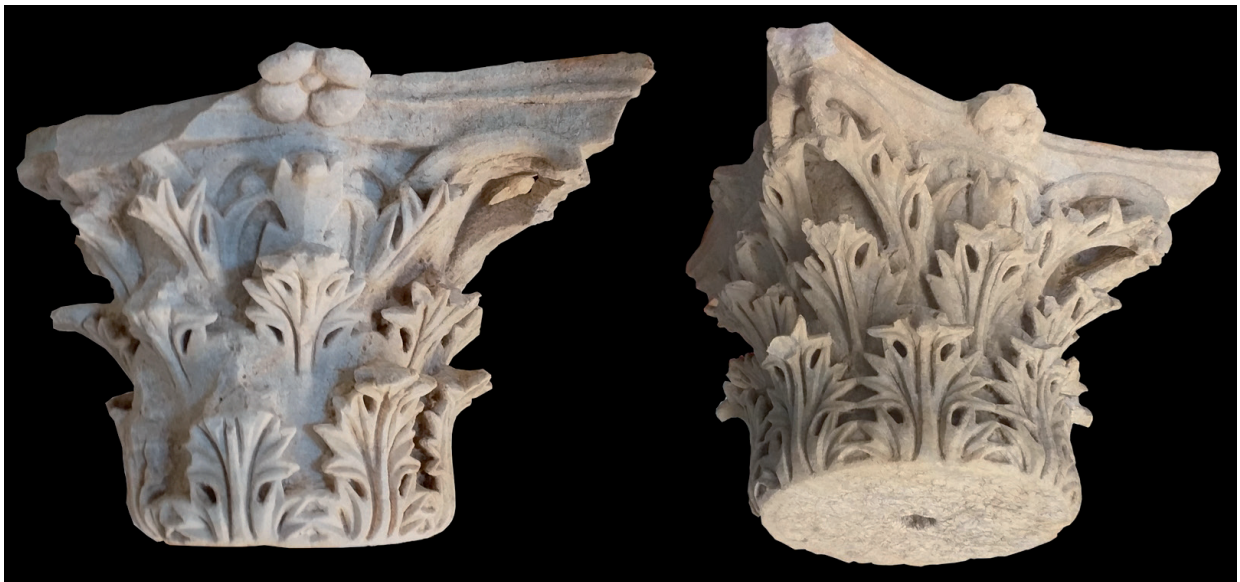
FIG. 7. Capiteles corintios del mausoleo T-32.