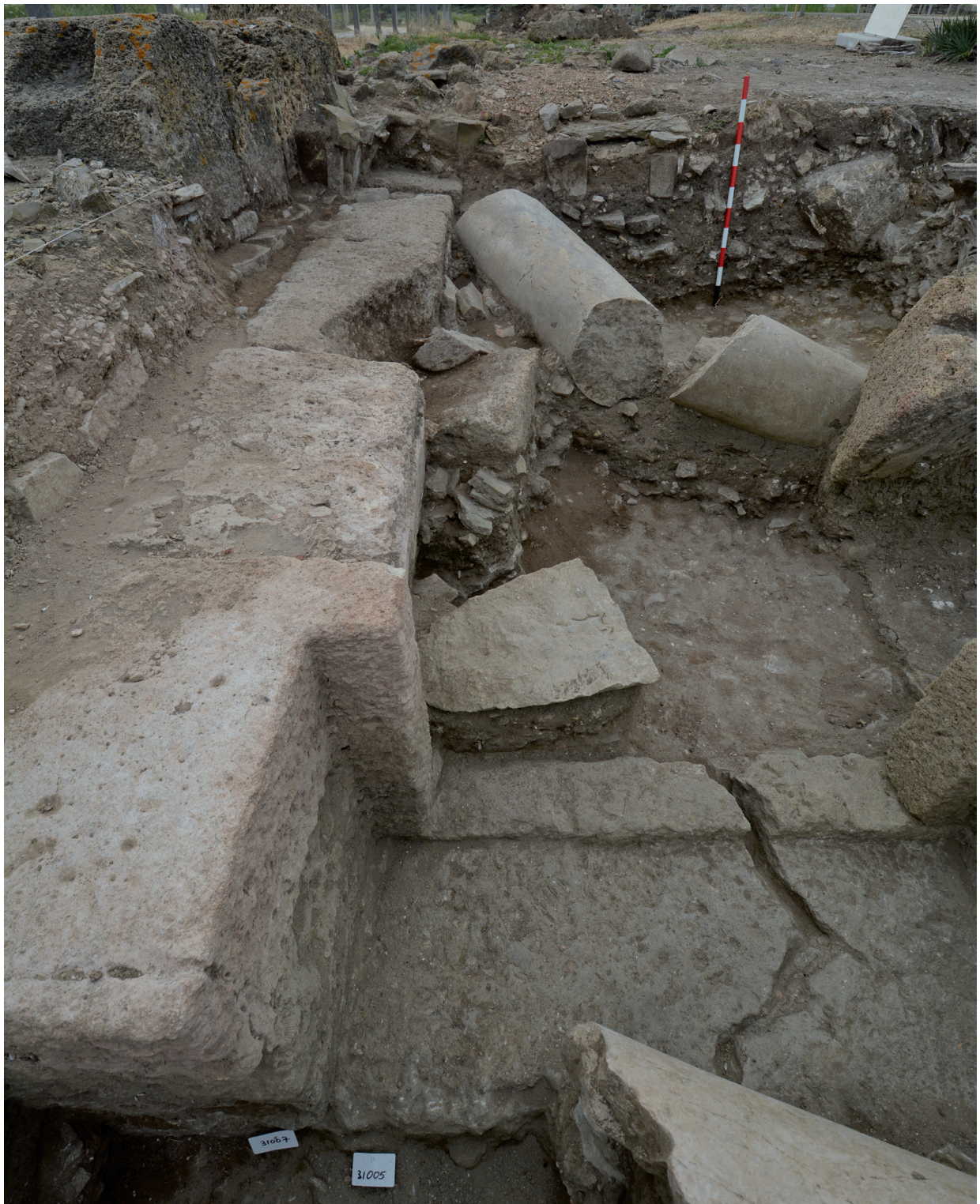
FIG. 10. Evidencias del seísmo en el acotado funerario de la T-32.