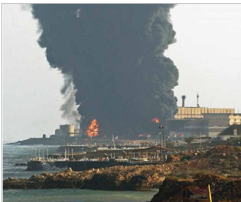
Incendio de los tanques de petróleo en la planta Jiyeh (Líbano), julio de 2006. Entre 10.000 y 15.000 ton. de petróleo fueron derramados al Mar Mediterráneo. UNEP.

En cuanto a la degradación de la biodiversidad, el impacto medioambiental de Jiyeh representó una seria amenaza para la fauna y la flora del litoral, del fondo marino y de la reserva natural de Palm Islands. En concreto, para las aves migratorias y las tortugas marinas. Además, el conjunto de la fauna y la flora de los sedimentos marinos quedaron asfixiadas por el vertido. Finalmente, a la catástrofe ecológica del litoral libanés se añaden los incendios ocasionados en el sur del país, que arrasaron las especies de árboles con valor económico, y milenarios cedros libaneses 19 .