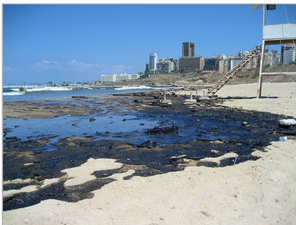
Petróleo de la central eléctrica de Jiyeh desparramado en las playas de Beirut.

Desde 2006, y aún sin respuesta, la Asamblea General de ONU repite su solicitud al Gobierno de Israel de que asuma la responsabilidad de indemnizar rápida y adecuadamente al Gobierno del Líbano y a la República Árabe Siria, de acuerdo a la evaluación de los daños ambientales ocasionados por la última guerra.