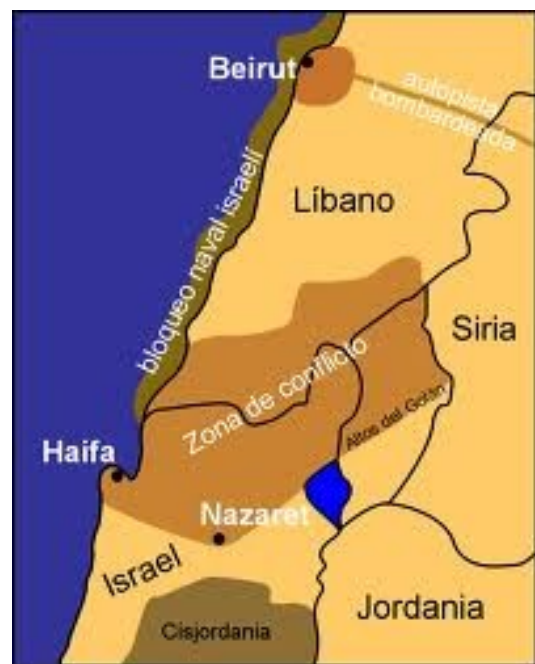
Zona de conflicto de la guerra Líbano-Israel 2006.

El Gobierno de Israel se fijó como metas de la operación en el Líbano, la liberación de los dos soldados capturados, el cese de los disparos de cohetes a poblaciones israelíes, y la aplicación de la Resolución 1559 de 2004 del Consejo de Seguridad de Na-