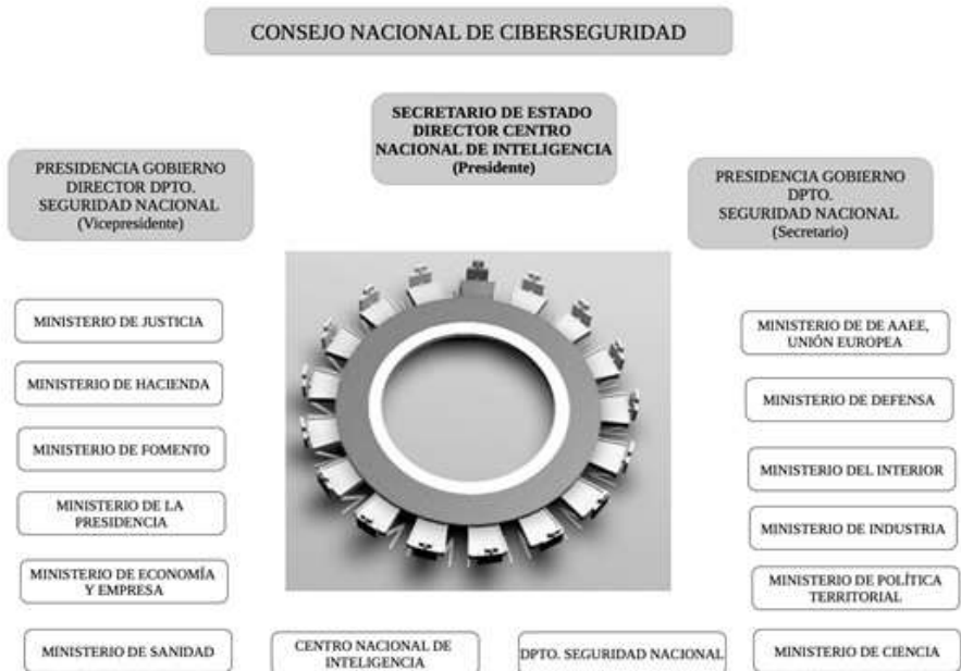
Figura 3. Composición del Consejo Nacional de Ciberseguridad

La segunda de sus funciones es la de asistencia (además de al Consejo Nacional de Seguridad Marítima, Comité de Situación para la gestión de crisis, Comité Especializado de Inmigración, Comité Especializado de No Proliferación y Comité Especializado de Seguridad Energética) al Consejo Nacional de Ciberseguridad (CNC) (figura 3).