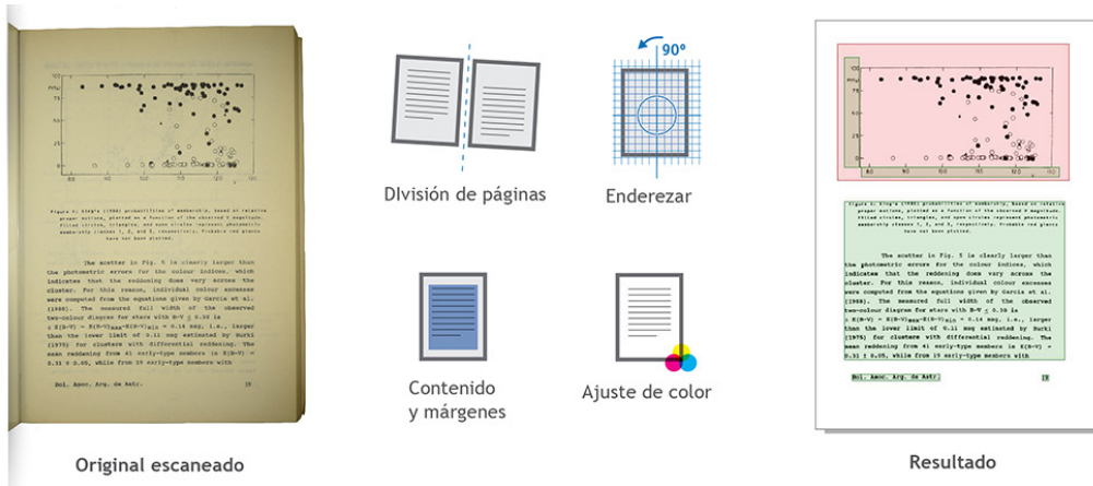
Figura 2: El software SCANTAILOR ADVANCED permite la manipulación de las imágenes obtenidas. Dibujos realizados por Lucas Folegatto.