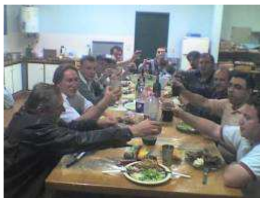
Figura 4: Cierre del ciclo de conferencias, en la EPET N° 3.

Un tema no menor resulta la implementación del refrigerio. Nos resultó en algunos casos un elemento aglutinador, que favorecía el éxito de la convocatoria. Así, por ejemplo, las conferencias realizadas en la EPET N° 3, las conferencias finalizaban con una cena de camaradería, que nadie deseaba perder. Hemos observado que esta práctica actúa como agente de distensión y de vinculación predisponiendo positivamente tanto a la concurrencia de los invitados, como así también a un cierto grado de acercamiento, interacción con los docentes, intercambios de experiencias, contactos con otras instituciones, etc.