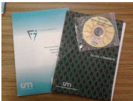
Figura 2: Material didáctico entregado a los asistentes.

Se solicitó a la Secretaría de Extensión de la Facultad de Ingeniería, la elaboración de Certificados de Asistencia para cada uno de los participantes que hayan cumplimentado con la participación de por lo menos el ochenta por ciento de las conferencias. Una vez cumplido el circuito interno de registro y firmas, los certificados fueron entregados a los asistentes