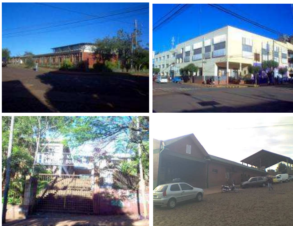
Figura 1: vista de los establecimientos beneficiados con los trabajos de extensión.

Se observó con satisfacción, que algunos docentes asistidos, ejercían la labor docente en otras escuelas, con lo cual vimos que se extendería más allá de lo previsto la socialización de los conocimientos adquiridos. El primer trabajo se ejecutó con la Escuela de Comercio N° 1 y el Instituto Privado Carlos Linneo, mientras que el segundo trabajo se desarrolló con el Colegio Nacional y la Escuela Provincial de Educación Técnica N° 3. Todos los establecimientos están situados dentro del ejido urbano de la ciudad de Oberá (Figura 1).