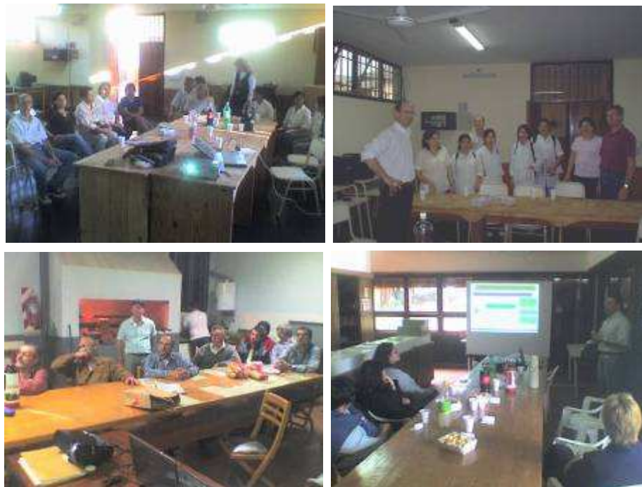
Figura 5: Grupos de docentes y alumnos, asistentes a las conferencias.

Este hecho, que demuestren un bajo interés en el tema, nos permite concluir que resulta necesario trabajar más en los establecimientos educativos sin una marcada orientación tecnológica.