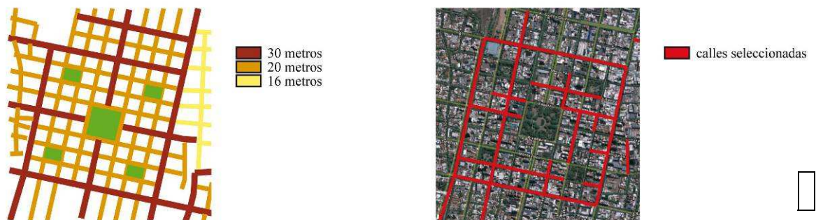
Figura 3: mapa de ancho de cañón vial, ciudad de Mendoza. Figura 4: mapa de calles seleccionadas para el estudio, ciudad de Mendoza.

En el actual tejido de la ciudad de Mendoza encontramos principalmente tres tipos de cañones viales en cuanto a los anchos de los mismos: de 16 metros, de 20 metros y de 30 metros (Córlica, 2007) (fig. 3), siendo los de 20 y 30 metros de ancho los que se encuentran en el área seleccionada para el estudio. Asimismo se tuvieron en cuenta las principales orientaciones de las calles en la ciudad, Este-Oeste, Norte-Sur. Interrelacionando estas dos variables se seleccionaron las calles que iban a conformar la muestra (fig. 4).