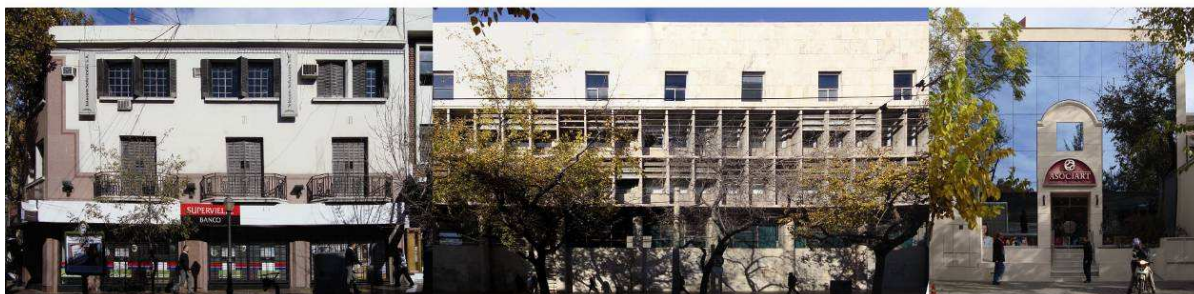
Figura 25: Casa González Pinto, esquina Espejo y San Martín, ciudad de Mza. (1893). Figura 26: Correo central, esquina Colón y San Martín, ciudad de Mza. (1948) (Cirvini, 2005). Figura 27: Asociart, calle 25 de mayo, ciudad de Mza.

Del análisis de los morfogramas se pudo detectar una relación directa entre el tipo de sistema de control empleado y las tecnologías disponibles y tendencias formales del momento en que se construyó el edificio. Se distinguen claramente tres etapas: entre fines de siglo XIX y principios de siglo XX tendencia hacia las celosías (fig. 25), a mediados de siglo XX periodo correspondiente al racionalismo se intensifica el uso de parasoles (fig. 26). El monumental edificio del Correo Central (Av. San Martín y Colón) es una muestra acabada de la arquitectura racionalista de inspiración lecorbusierana del período (Ponte, 2008). Actualmente existe una tendencia hacia el uso de filtros (fig. 27) como elemento de control solar, el 14% de los sistemas de control concebidos con el proyecto arquitectónico original corresponden a filtros.