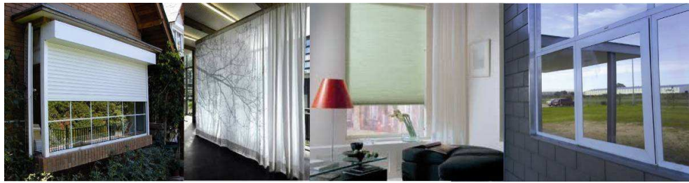
Figura 12: cortina de enrollar exterior. Figura 13: cortina textil interior. Figura 14: cortina de tela de enrollar interior. Figura 15: filtro espejado.