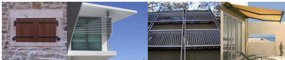
Figura 20: postigo. Figura 21: estantes de luz horizontales. Figura 22: estantes de luz verticales. Figura 23: toledo.

Esta aproximación desde lo morfológico y tipológico ofrece una herramienta para el análisis de la iluminación natural en edificios que media entre los estudios de carácter estrictamente científico y los métodos de diseño tradicional en arquitectura (Lukman N.).