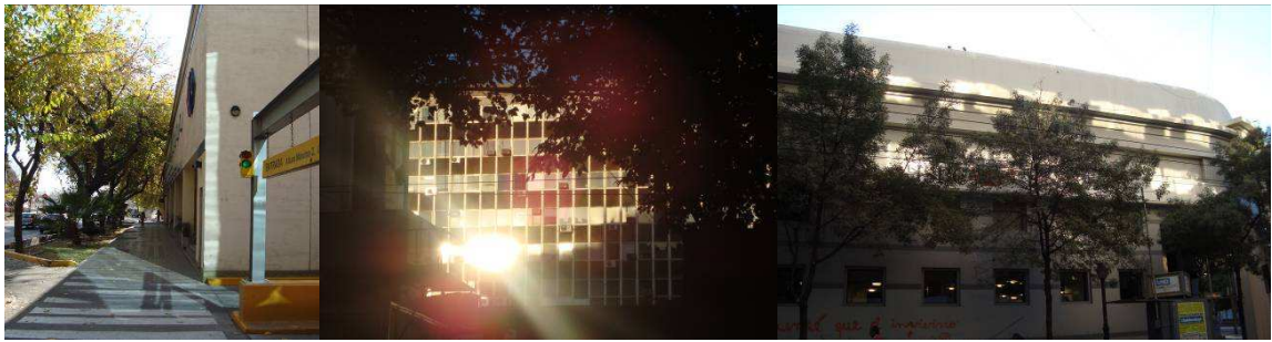
Figura 28, 29 y 30: ejemplos de situaciones que representan riesgo de deslumbramiento en la ciudad de Mendoza.

Asimismo los filtros modifican el color de la luz natural, generando en los usuarios, de espacios interiores con filtros en sus aventanamientos, incertidumbre sobre las condiciones del clima exterior y desorientación temporal (hora del día).