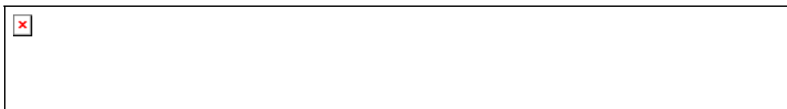
Figura 10: planilla de traspaso de datos, (cañón vial urbano (CVU), Norte (N), Sur (S), Este (E), Oeste (O)).

Se realizó el traspaso de los datos a una planilla de Excel para organizar el material fotográfico recopilado (fig. 10).