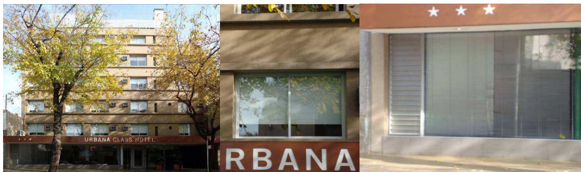
Figura 7: panorámica. Figura 8: detalle, cortina de tela de enrollar interior. Figura 9: detalle, veneciana interior.

Para el análisis morfológico se tomaron fotografías de los edificios no residenciales de más de tres pisos de altura ubicados en el área seleccionada, tanto de sus fachadas completas (panorámica) (fig. 7) como también de detalles de los componentes de paso y de los sistemas de control que presentan cada uno de los frentes analizados (fig. 8 y 9).