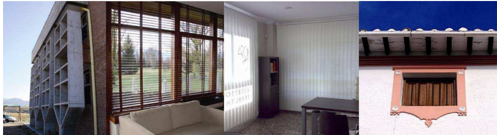
Figura 16: parasoles. Figura 17: venecianas horizontal interior. Figura 18: veneciana vertical interior. Figura 19: alero.