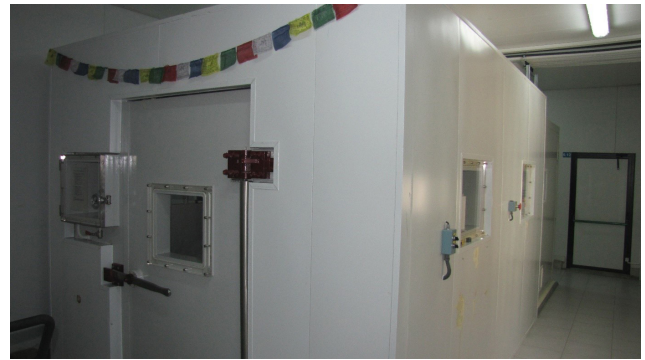
Fig. 2. Cámara hipobárica del Servicio de Hipobaría y Fisiología Biomédica de la UB.

crónica como la bien conocida pérdida de peso y el deterioro neuronal y muscular. No como alternativa a la aclimatación in situ, sino como una forma de acelerar o avanzar el proceso, nuestro grupo de investigación ha desarrollado programas de exposición intermitente a hipoxia hipobárica. Esto permite alcanzar un estado de pre-aclimatación previamente a la partida de la expedición. El fundamento de esta técnica se basa en la teoría del entrenamiento: