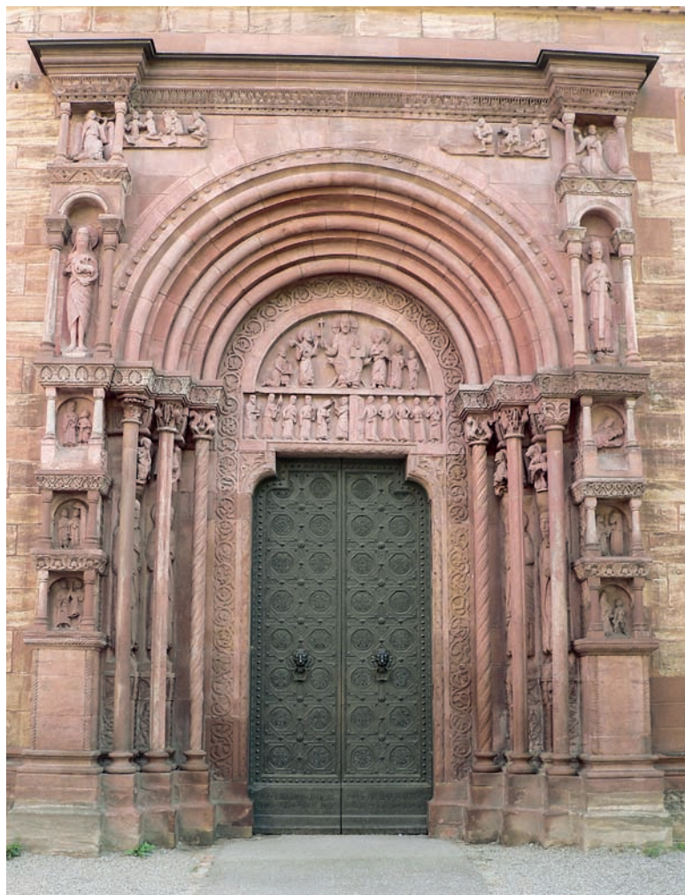
Fig. 1. Puerta de Saint-Gall o “Galluspforte” de la catedral de Basilea (Suiza)

entre 1185 y 1202 20 . Centra la composición de su tímpano (Fig. 2) la imagen de Cristo, que aparece sentado en un faldistorio con sus extremos superiores rematados por sendas cabezas de fieras que muestran sus fauces. Lleva nimbo crucífero y porta en sus manos un libro abierto y un cetro terminado con una cruz del que cuelga un ondeante pendón. A su diestra, la imagen de san Pedro, identificado por las dos llaves que sujeta con la mano derecha, está de pie y eleva el brazo izquierdo mostrando una actitud de comunicación con el Señor. Detrás de él un personaje barbado y arrodillado, con la cabeza cubierta por un gorro y vestido con larga túnica