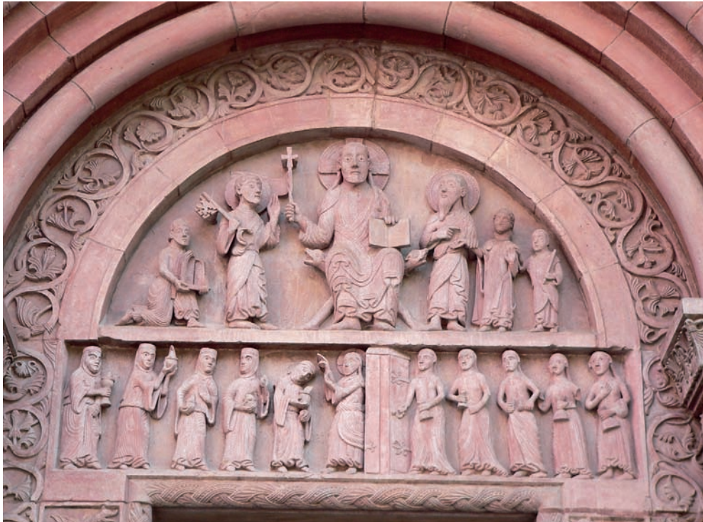
Fig. 2. Tímpano de la portada de Basilea

ceñida con un cinturón, sostiene en sus manos la maqueta de una portada en la que uno de los dos batientes aparece entreabierto. Al otro lado de Cristo, y dirigiendo su mirada hacia él, la imagen, también erguida, de san Pablo sujeta con su mano el antebrazo de un personaje femenino de menor tamaño, al que señala con el dedo. Esta mujer, que eleva su mano izquierda mostrando la palma en señal de aceptación, viste una saya con mangas largas y estrechas, encima de la cual lleva un pelliz de mangas muy anchas, con el escote y el centro del pecho adornados con un bordado, y sobre todo ello un manto. Su cabeza, como ya ha puesto de manifiesto algún especialista 21 , no se corresponde con la original, puesto que esta, por causas que se desconocen, quizás como consecuencia del terremoto de 1356, fue sustituida, con anterioridad a la última restauración realizada en el siglo XIX 22 , por otra que no encaja muy bien con el cuerpo. Detrás de esta mujer y apoyando la mano en su hombro, la figura de un ángel de pie, cuyo tamaño se adapta al espacio disponible en la esquina del tímpano, sostiene en su mano izquierda una especie de palo, y cubre con sus dos alas, una sobre la otra, la parte delan-