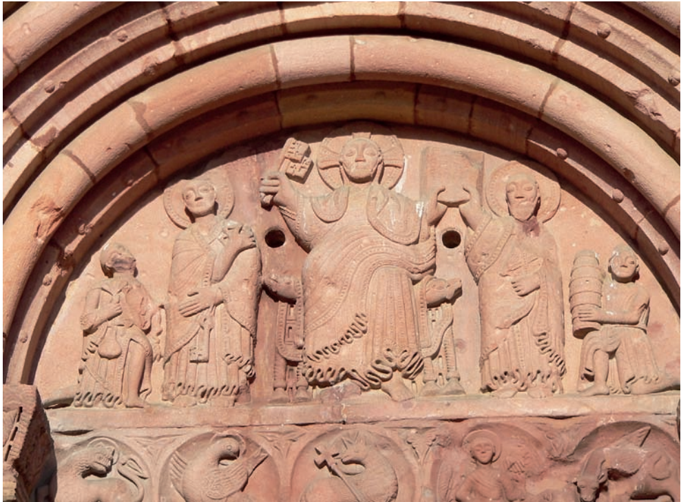
Fig. 4. Tímpano de la portada de Saint-Pierre-et-Paul de Sigolsheim (Haut-Rhin, Francia)

personaje es su vestimenta, pues es muy similar, gorro incluido, a la del individuo de Basilea (Fig. 5). En el caso de Sigolsheim es evidente que no puede tratarse del constructor, pues el objeto que sujeta nada tiene que ver con dicho oficio. Esta comparación permite descartar las hipótesis que, basándose en las características de sus atuendos, ven en el donante del tímpano suizo al artífice material de la portada.