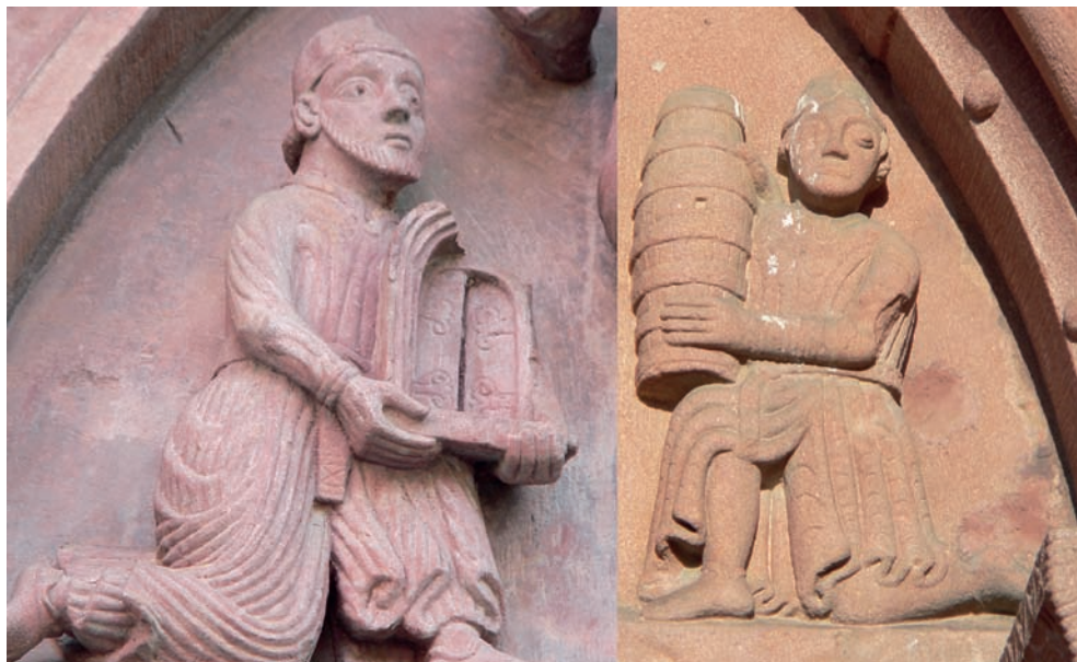
Fig. 5. Comparación entre el donante de Basilea y el de Sigolsheim

llamar la atención de Cristo sobre ella 36 , y con el ángel, que la acompaña, más que empuja. Este especial protagonismo de la dama en relación con los seres sagrados, que contrasta con la apartada y discreta posición del donante masculino, entendemos que debe ser asociado con el hecho de que las acciones de misericordia representadas sean, muy posiblemente, ejecutadas por una mujer, cuando lo que cabría esperar, al ser dos los presuntos donantes, es que fueran realizadas por ambos, o incluso solo por un hombre si fuera cierta la interpretación propuesta por Elliott 37 .