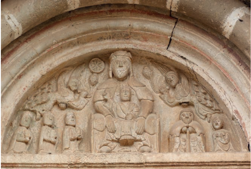
Fig. 7. Tímpano de la portada de la iglesia de Sant Martí de Mura

san Martín, advocación del templo y santo cuya vida está representada, como veremos, en los capiteles de la portada, el hecho de que no porte mitra ni báculo, atributos asociados a su dignidad episcopal, nos lleva a descartar dicha identificación. Sin embargo, para poder considerar de forma concluyente que se trata de la figura de un donante, hemos de analizar el programa iconográfico global de la portada, cosa que no se ha hecho hasta el momento.