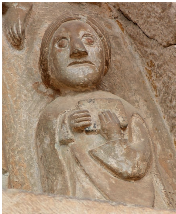
Fig. 8. Imagen de donante en la portada de Mura

en el tímpano de Jaca o en la escena de Daniel en el foso, una alegoría del Juicio Final 45 . Todo ello aporta elementos suficientes para poder ver en el programa iconográfico de la portada de Mura un manifiesto interés por la salvación del alma y la alusión a la caridad como medio para conseguirla, lo cual todavía le da más sentido a la presencia de un donante en el tímpano. De esta forma, como hemos comentado que ocurría en Basilea, en Mura aparecen también asociados la figura de un donante, la caridad y el Juicio Final.