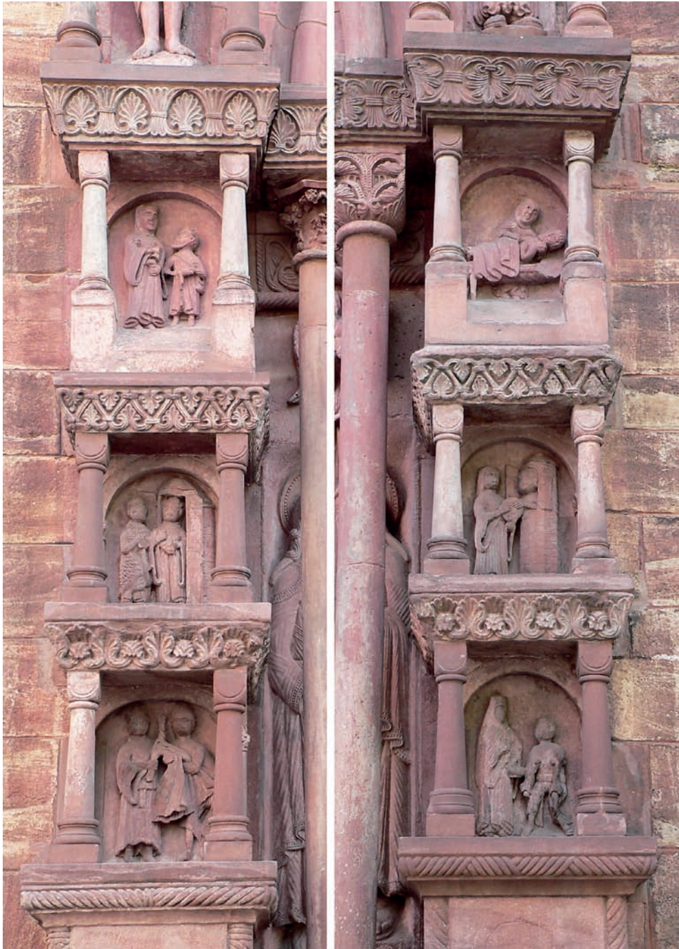
Fig. 3. Representación de las obras de caridad en la portada de Basilea