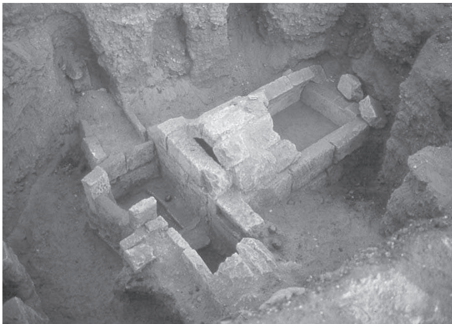
Figura 2. Tomba saïta número 13.