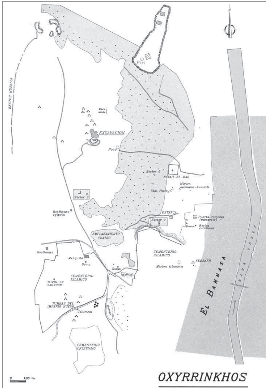
Figura 1. Plànol topogràfic del conjunt arqueològic d'Oxirrinic.