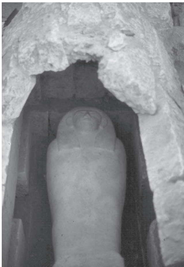
Figura 3. Sarcòfag antropomorf de l'època saïta.

de precisar. Els saquejadors hi van entrar desmuntant els carreus de la volta. El reaprofitament cristià del conjunt es constata en unes deposicions que hi ha a les dues cambres laterals i que segueixen els rituals descrits. En un cas, fins i tot es van desplaçar les despulles d'un cos momificat i es van arraconar al fons de la cambra. Com a única troballa destacable del període cristià relacionada amb aquesta tomba número 13, hem de fer esment d'una moneda de l'època bizantina que ens situa pels volts de la primera meitat del segle VII. Aquesta dada cronològica, l'única de què disposem per datar el cementiri cristià tret d'alguns fragments de ceràmica que confirmen l'horitzó, ens permet suposar que ens trobem davant de l'última ocupació funerària de tot el sector excavat de la necròpolis d'Oxirrinc.