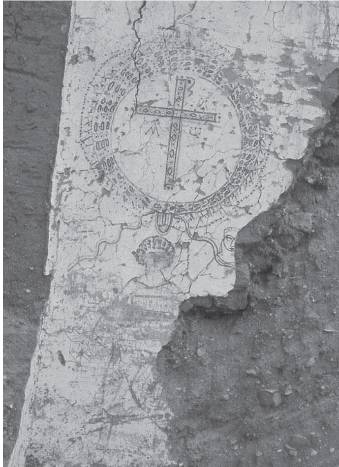
Figura 5. Pintura mural en què hi ha una creu monogramàtica i dos personatges.