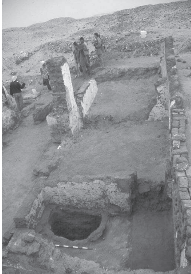
Figura 4. Vista parcial de la capella cristiana.

pat ritual. Entre els cristians, el refrigerium vora la tomba expressava l'acte de refrescar la memòria dels morts i s'acostumava a fer amb aigua freda, pa, vi i altres menjars austers. Es pensa que aquesta tradició era, probablement, d'origen egipci. L'espai està decorat amb pintures: dues tabulae ansatae amb signes críptics i grafits gairebé il·legibles.