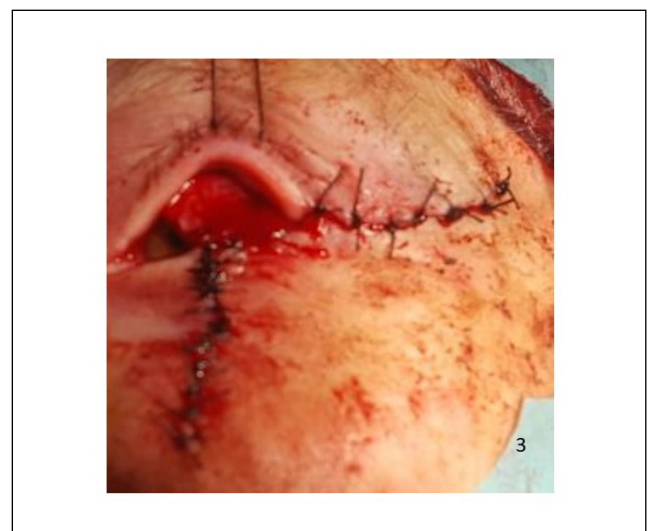
Figura 3. Resultado final del colgajo de Hughes.

El estudio histológico confirmó el diagnóstico clínico así con márgenes laterales y profundo de resección quirúrgica libres de neoplasia. Actualmente la paciente se encuentra en seguimiento por nuestra unidad (Fig.3).