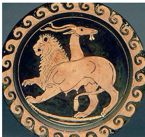
KUVA 1. Kimeera (khimaira) eli tarunomainen vuohileijona-käärme.

CAR tarkoittaa kimeeristä antigeenireseptoria. Kimeerinen on johdettu kreikan sanasta khimaira, joka tarkoittaa kimeeraa, kreikkalaisen mytologian Lyykiassa riehunutta tulta syökse-