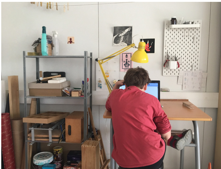
Figura 3. Zona de trabajo compartida entre artistas y alumnos del taller de la escuela Els Encants, 2019.