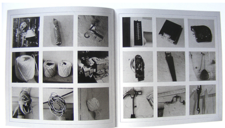
Figura 1. Sol LeWitt, Autobiography (1980). Libro de artista. The MET's Collection. © 2018 Artists Rights Society (ARS), New York.

Para construir este Foto Ensayo hemos partido de la obra Autobiography del artista Sol LeWitt (1980), un libro de artista que realizó a partir de una secuencia de más de mil fotografías en blanco y negro cuadradas, organizadas en una retícula de nueve imágenes por página. En esta obra LeWitt catalogó minuciosamente cada objeto de su vivienda-taller en Nueva York, donde el artista vivió y trabajó durante más de veinte años. Mediante la sucesión de imágenes, la obra nos muestra su experiencia vital del día a día, aunque él no aparezca retratado en las imágenes. Las fotografías son sencillas técnicamente y se muestran ordenadas de forma reticular y democrática, pues en su presentación ninguna imagen es más importante que otra. A diferencia del lenguaje verbal, que es lineal, el significado de las imágenes es variable, y las imágenes pueden ser “leídas” horizontalmente, verticalmente, en diagonal o ser vistas como una sola imagen (Garrels, 2000, p.102).