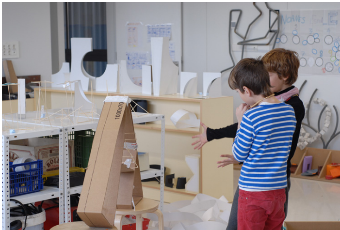
Figura 6. Zona de trabajo compartida entre artistas y alumnos del taller de la escuela Els Encants, 2016. Esculturas de los alumnos y del artista.