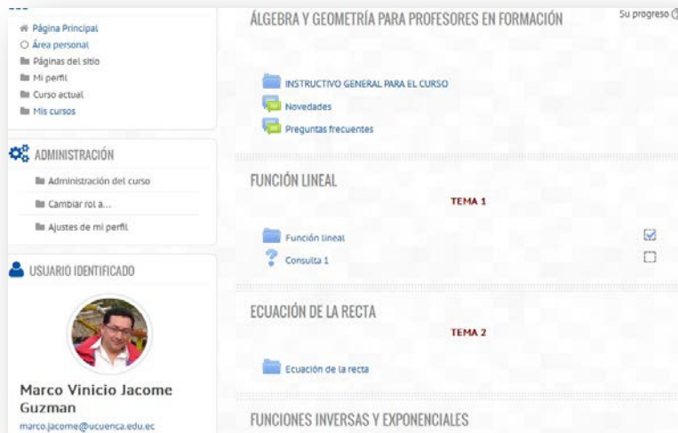
Imagen 1: Interfaz de Moodle creada para el curso adaptado a la metodología Mooc Los recursos multimedia se los realiza con la ayuda de las herramientas, entre ellas: Prezi, Camtasia o Youtube. Uno de los videos con el material preparado presenta este aspecto: