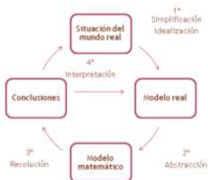
Figura 1. Proceso de modelación matemática

El objetivo de este taller es generar una instancia reflexiva sobre el tratamiento de la modelación matemática. Para ello, consideramos dos contenidos principales, uno que emerge desde la matemática: la modelación matemática y otro relacionado con la didáctica de la matemática: la reflexión sobre la práctica (Schön, 1983). Una de las habilidades complejas que debe promover el profesor en el aula está la modelación matemática, de manera de ser bordado en reuniones científicas como la International Conference on the Teaching of Mathematical Modelling and Applications, ICTMA (Matos, Blum, Houston y Carreira, 2001). La podemos definir como un proceso que conlleva cuatro fases principales (Ramos, 2014): identificación del modelo real, construcción del modelo matemático, elección de los contenidos y utilización de métodos matemáticos apropiados, y la interpretación y validación (Figura 1).