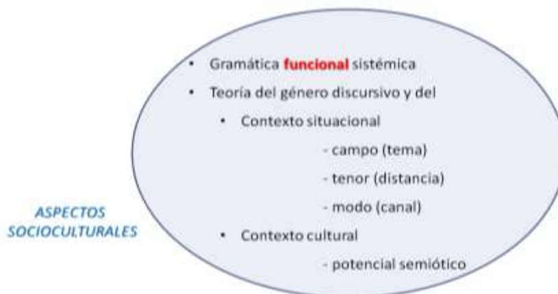
Figura 3 – Lingüística Sistémico Funcional

Cada estrato es una red de sistemas en el que operan las funciones semánticas fundamentales: la experiencial, la interpersonal y la textual (Ver Figura 3).