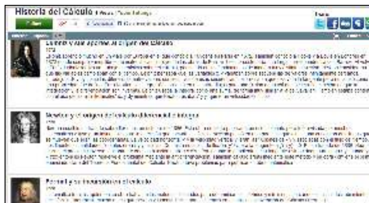
Figura 4. Descripción detallada de cada evento reflejado en la línea del tiempo

Una vez que los participantes habían culminado su línea del tiempo, para lo cual tuvieron tres semanas de realización, las mismas fueron publicadas dentro del grupo de facebook por los miembros. Se promovió la participación a través de comentarios, así como la discusión de algunos eventos reflejados en las líneas creadas. Finalmente, en la etapa de reflexión y evaluación, los participantes expresaron su satisfacción por el uso de esta herramienta tecnológica y por un mejor dominio de algunos aspectos históricos relacionados con el tema matemático abordado. La evaluación de las líneas del tiempo por parte del docente-investigador se realizó a través de una rúbrica que permitía identificar la presencia de ciertos elementos claves en el diseño de las líneas como la incorporación de elementos multimedia, identificación de la línea, redacción y ortografía, relevancia de los eventos reflejados, actividades propuestas en torno a la línea de tiempo.