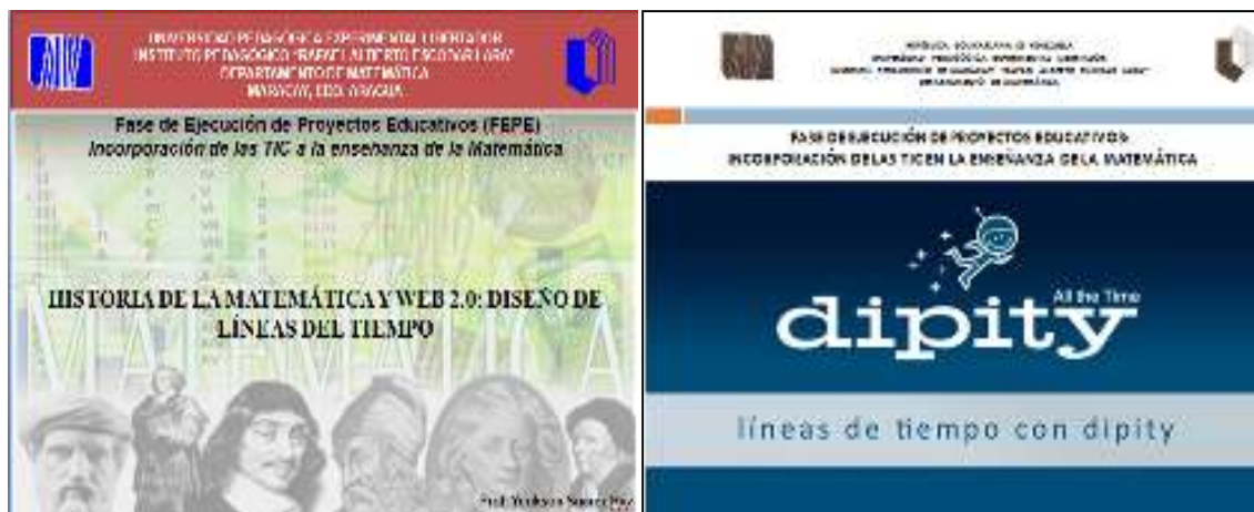
Figura 1. Presentación sobre Historia de la Matemática y líneas del tiempo bajo el contexto de la Web 2.0

Seguidamente, para la creación de las líneas del tiempo se les solicitó a los estudiantes para profesores que en primera instancia seleccionaran un tema o contenido matemático de su preferencia y adaptado a cualquier nivel educativo. Una vez hecho esto, realizaron una indagación documental en libros de Historia de la Matemática de autores como Rey Pastor, o Carl Boyer entre otros; con la finalidad de ubicar algunos hitos o acontecimientos relevantes que abordasen o hicieran referencia a personajes, problemas o situaciones que contribuyeron a la génesis y evolución del contenido matemático en cuestión. Este proceso de revisión de la literatura se acompañó con una búsqueda, a través de la Internet; de imágenes, enlaces, fotografías o videos relacionados con la temática.