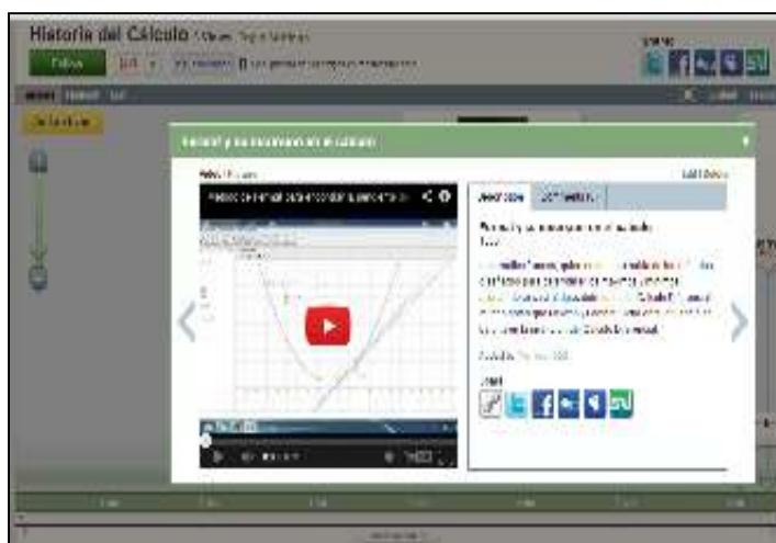
Figura 3. Elementos multimedia incorporados a la línea del tiempo.

En la figura 3 se puede apreciar la incorporación de elementos multimedia como imágenes y videos, los cuales sirven de apoyo a cada una de las entradas (eventos) introducidas en la línea del tiempo. Los videos fueron seleccionados por los participantes, quienes recurrieron a la plataforma de Youtube (www.youtube.com) y luego fueron insertados en la línea. Cada evento está compuesto por tres elementos claves. En primer lugar el título del acontecimiento que se reseña, el cual está ubicado en la parte superior; en segundo lugar una fotografía, imagen o video ubicado al lado izquierdo; y finalmente, una descripción del evento en la parte derecha del evento creado. En cada uno de los acontecimientos es posible dejar comentarios; por ello, en cada caso se han incorporado a la descripción un conjunto de interrogantes, reflexiones para el debate, o propuestas de problemas; con los cuales participarían los estudiantes a la hora de interactuar en clase.