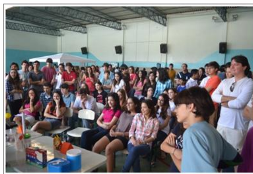
Apresentação para a escola.