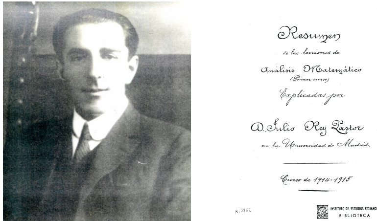
FIGURA 1. Julio Rey Pastor en 1915 en Zaragoza y portada del primer Resumen de sus lecciones en Madrid, 1914-15.