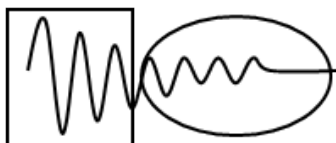
Figura 2. Lo estable está en la altura de los picos

Tal vez matemáticamente esto sea erróneo, pero lo importante aquí es enfocarse en la manera en que se construyen esos argumentos para resignificar su conocimiento y el por qué lo hacen de esa manera. Lo que se pretende es explorar cómo está expresado ese conocimiento desde su cotidiano.