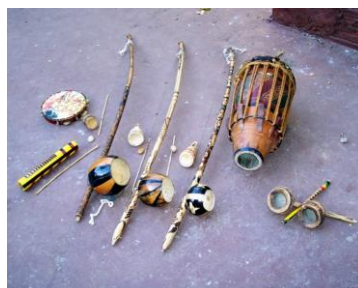
Figura 1 – Alguns Instrumentos de capoeira

Dessa forma, iniciaremos com a apresentação de um documentário falando sobre a história da capoeira no Brasil. Prosseguiremos com a apresentação dos instrumentos: berimbau e pandeiro e explicar como se dá o compasso no acompanhamento das palmas e no canto.