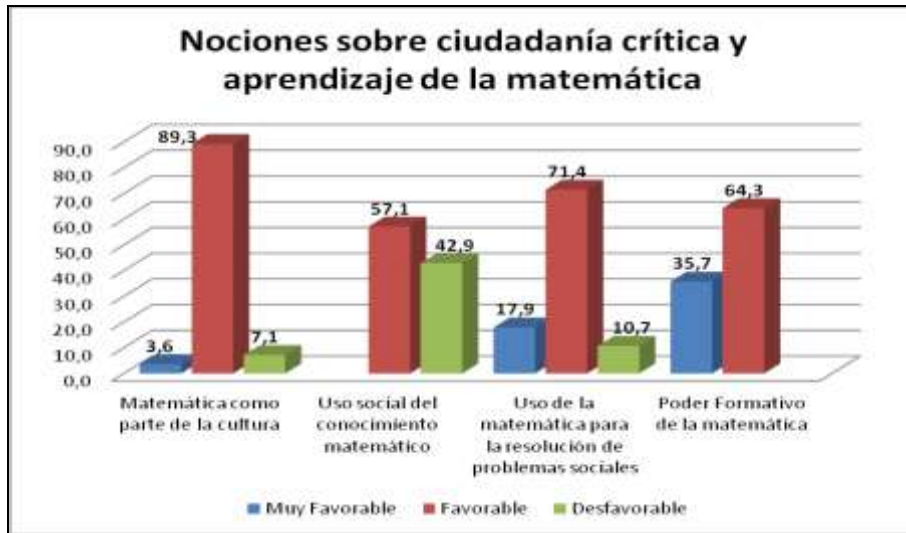
Grafico N°2. Comparativo de porcentajes según sub categorías asociadas a la noción de ciudadanía crítica y aprendizaje de la matemática.

Analizando los resultados de la categoría “Ciudadanía crítica y aprendizaje de la matemática” de acuerdo al gráfico N°2 es posible constatar que si bien existe mayormente una actitud favorable por parte de los encuestados hacia las subcategorías consideradas, también se evidencia la presencia de actitudes desfavorables en las tres primeras dimensiones; la matemática como construcción humana 7,1%; “Uso social del conocimiento matemático” con un 42,9% y “Uso de la matemática para la resolución de problemas sociales” con un 10,7%.