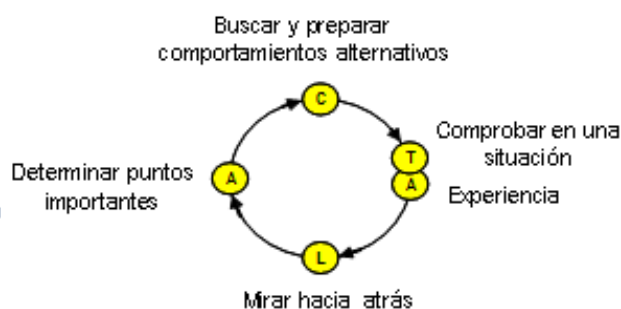
Figura 15. Modelo ALaCT (Korthagen, Kessel, Koster y Wubbels, 2001)

Dentro de los modelos utilizados en educación matemática, hemos seleccionado uno surge desde la psicología cognitiva (Korthagen y Verkuyl, 1987). Nos referimos al modelo reflexivo ALaCT de Korthagen. Este autor describe el proceso destinado al aprendizaje reflexivo, al que denomina proceso ALaCT , como un proceso cíclico en el que se pueden distinguir cinco etapas o fases.