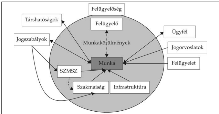
1. ábra: A felügyelési miliő modellje a munkakörülményeket befolyásoló tényezőkkel

A felügyelési munkakörülményeket alakító tényezők közül elsőként a szervezeti felépítés hatását mutatjuk be a felügyelőségek munkakörülményeire. Ezt követően a felügyelési főbb munkakörök, szakmák és munkakapcsolatok ismertetésére vállalkozunk.